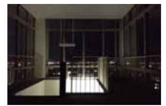
UR 男山団地 高層棟の展望室

近年イベント時に解放している男山団地の高層棟。男山では一番高い建物です！ここからの眺望は抜群！以前は開放していたようですが、現在は常時閉鎖しています。使い方やルールを決めてうまく活用したいところです。