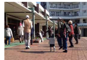
たまたま前を通りがかった人、バスを待つ人、ベランダから参加してくれる人もいます。

《活動の経緯は?》 東公園では毎朝ラジオ体操に大勢の人が集まるといった情報が、すぐさま真似してみました。