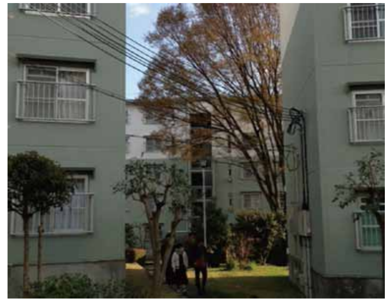
5階建ての団地よりも大きな木を発見！メンバーもびっくり！

しかし、「せつかく刈られた低木もだんだん草が伸びてきている」といった管理についての意見や「集会所をコンバージョンし、新しい機能を」というアイデアも挙げられました。 「工夫次第で地域の財産になること、まだまだもったいないことがたくさんありそう」ということで、今後もこういった機会の定期的な開催に向けて現在企画をしています。関心のある方はぜひ一緒に考えてみませんか？