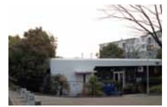
UR 男山団地 D地区の集会所

調べてみるとD地区の集会所は、他の集会所と比べ利用率が低いことがわかりました。周辺には、商店や保育園、中学校の施設があり立地も良好です。屋外空間と集会所を活用して、この場所を活性化できるかもしれません。