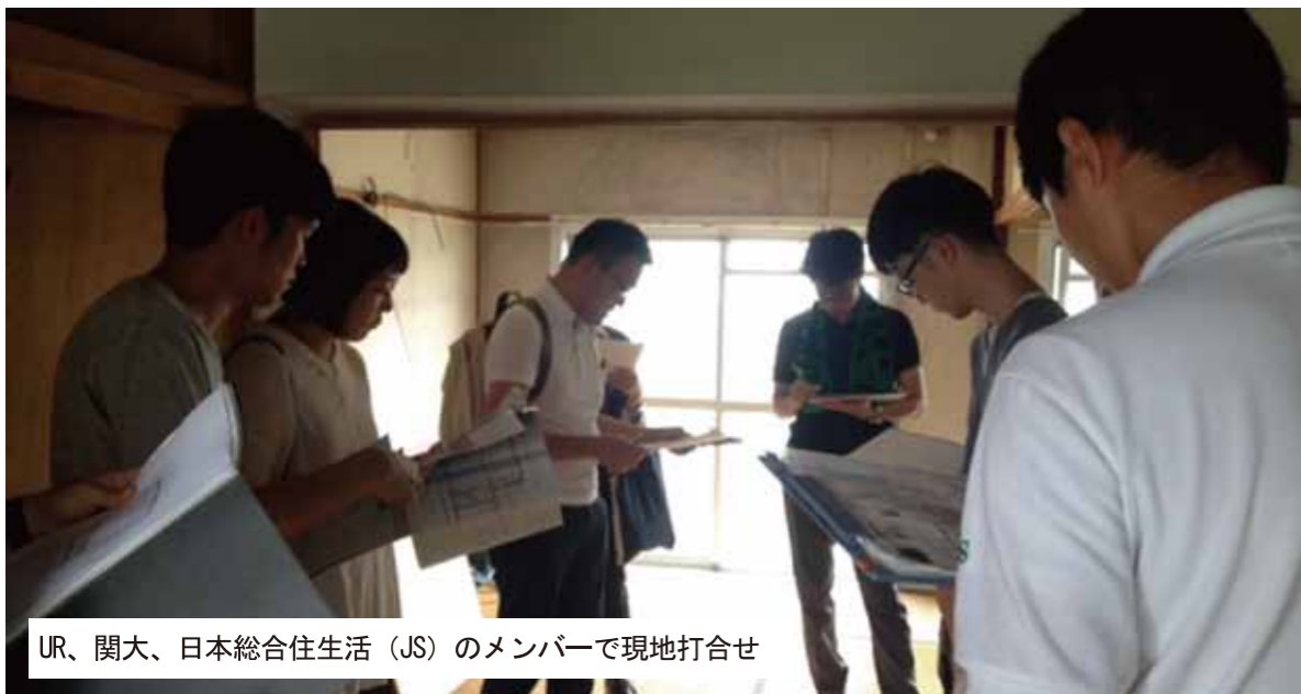
UR、関大、日本総合住生活 (JS) のメンバーで現地打合せ

UR都市機構と関西大学団地再編プロジェクトによるリノベーション住戸の設計が始まりました。今年度はA地区の東側のエリア17棟、20棟、24棟の住戸が対象となります。完成した住戸は、来年1月下旬から2月初旬で入居者の募集を予定しています。