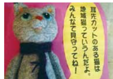
八幡市では、野良猫の避妊・去勢手術費用の一部に補助金を交付しています。

クローズアップ だんだんくくく だんだんテラスで活動されている方を紹介 八幡地域ねこを考える会