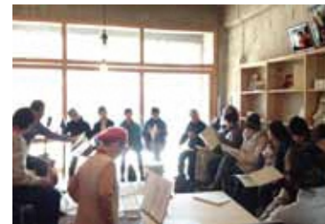
だんだんフォークのメンバーの生演奏に合わせて、みんなで歌います。

だんだんくくくだんだんテラスで活動されている方を紹介 だんだんみんなで歌ってみよう