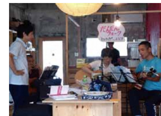
●毎月第3土曜日開催のやってみよう会議は、「自分のやりたいこと」を出発点とした活動を支援しています。