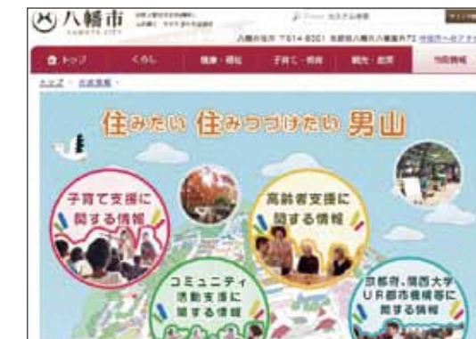
●「男山地域再生基本計画」は、市のホームページからも閲覧することができます。

「引っ越してきたばかりでなかなか地域行事に参加できない。参加するきっかけが欲しい。」まちづくりに関心はあるが、きっかけがなく参加できていないという意見もありました。このような意見を踏まえて、気軽に参加できる取り組みを企画したいと思います。