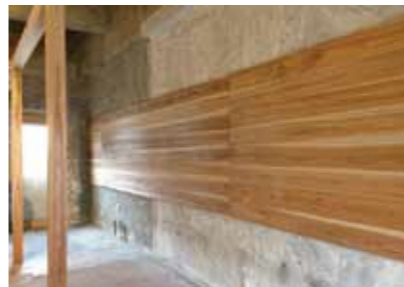
写真や絵画、立体物の展示也大歓迎です！ ギャラリーの利用希望者はだんだんラボまで！

ものづくりを通じた交流拠点として、地域の様々な方と協働してラボを盛り上げましょう！ みんなのスキルを持ち寄って新しいものを生み出そう！ 2月には八幡支援学校高等部と3月にはおもちゃ病院とコラボレーションしたイベントも企画しています！