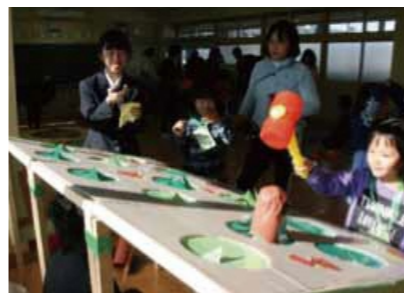
小学生や幼稚園のお友達、遊びに来てね！ 優しいお兄さん、お姉さんがサポートします！