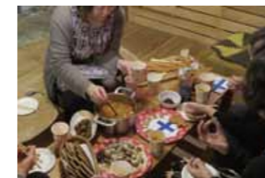
第1回「フィンランド料理」では、フィンランドに留学経験のある方が参加してくれました。

第三十九回だんだん句会 選句 幾千の駄句鎮魂の初詣 北海の荒波の雲丹膝に墮つ りしよう さよー