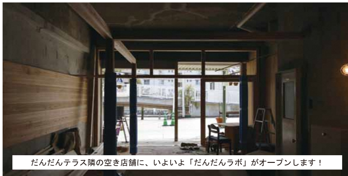
だんだんテラス隣の空き店舗に、いよいよ「だんだんラボ」がオープンします！

2月4日(日)にオープンする「だんだんラボ」でオープニングイベントを開催します！ だんだんラボができた経緯やUR男山団地で先駆的に進んでいる「ココロミタウン」プロジェクトについて、リノベーションした住戸の写真や手作り作品の展示をする予定です！みなさま是非「参加ください！」