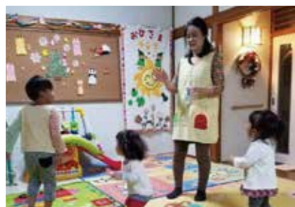
資格をもつ先生や地域のボランティアさんが常駐してくれています。

実施日 月・火・金曜日 10:00~16:00 第2・4土曜日 10:00~14:00 場所 UR 男山団地A地区集会所 団地以外の方も利用できます！