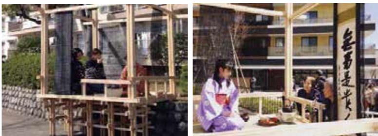
大学院生が設計・施工した「閑雲軒」 お手前を覗く参加者