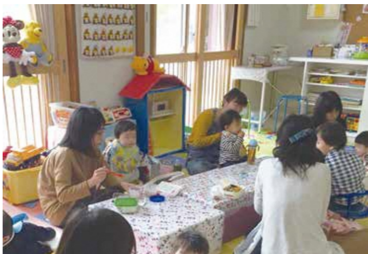
「実家のような雰囲気」と、利用者にとってホッと落ち着く居場所になっています。

UR 男山団地A地区に、集会所を活用した子育て支援施設「おひさまテラス」があるのをご存知ですか？ 新年度、男山地域に引っ越してきた方、そろそろ公園デビューを考えている子育て世代の方は、ぜひ気軽に立ち寄りください！おひさまテラスは、子育て奮闘中のパパママが交流できる居場所となっています。