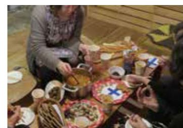
刃を回転させて、溝を切るボール盤。木材や鉄板に穴を開けることもできます。

「仲間と久しぶりに集まって、ワイワイ麻雀をしよう」そう思い立って麻雀卓をつくりにきた70代の男性。ボール盤を使い、溝を切る加工にチャレンジしました。初めて使う工具に、なかなか上手くいかなかったようでしたが、何度か試すうちに工具を上手に使えるようになりました。