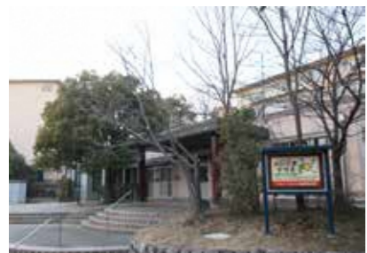
集会所の1室を活用しています。公園横の平屋の建物がおひさまテラスです。