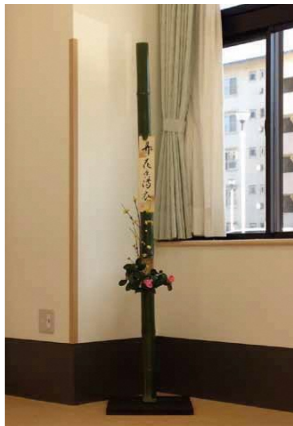
八幡たけくらぶの方に指導して頂き製作した「歌花筒」