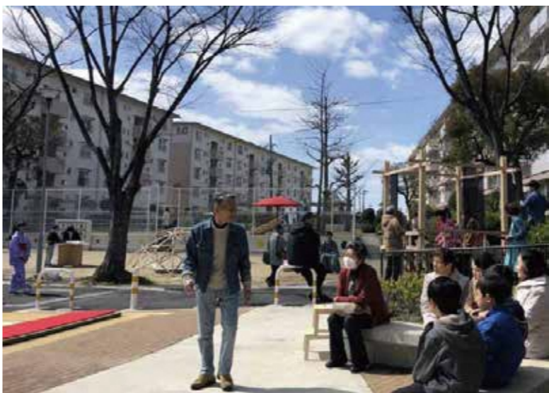
緑道でお茶会の風景

当日は150名を超える方がイベントに集まり、参加者は、「普段なかなか触れることのない、茶の文化に気軽に触れる機会となり楽しかった。」と笑顔で話してくれました。