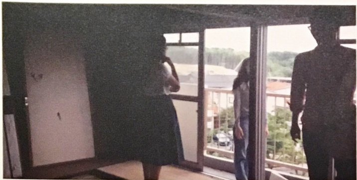
UR都市機構と関大のリノベーションでは、窓から見える景色にこだわりを持って住戸を選んでいる。

「高齢者が気軽に集まり、相談できる場をつくりたい」「大人が絵本を読む機会をつくって、絵本の素晴らしさを伝えたい」「団地の屋外でヨガ教室をしてみたい」となど色んな想いに触れる機会となりました。やってみよう会議は、誰もが参加自由な場ですので、「こんななご地域でやりたい」という想いをもちの方は、気軽に1人参加ください。