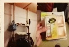
初心者でも簡単にDIYできる商品が、ホームセンターで手軽に買うことができます!

「この板を切ってもらえませんか?」家にあった端材を使って棚板をつくりたいとだんだんラボに来られた女性。C地区にお住まいで色々DIYを楽しんでいると聞きお家にお邪魔しました。「これが賃貸の団地には便利」と自由自在に柱を立てれる商品を見せてくれました。