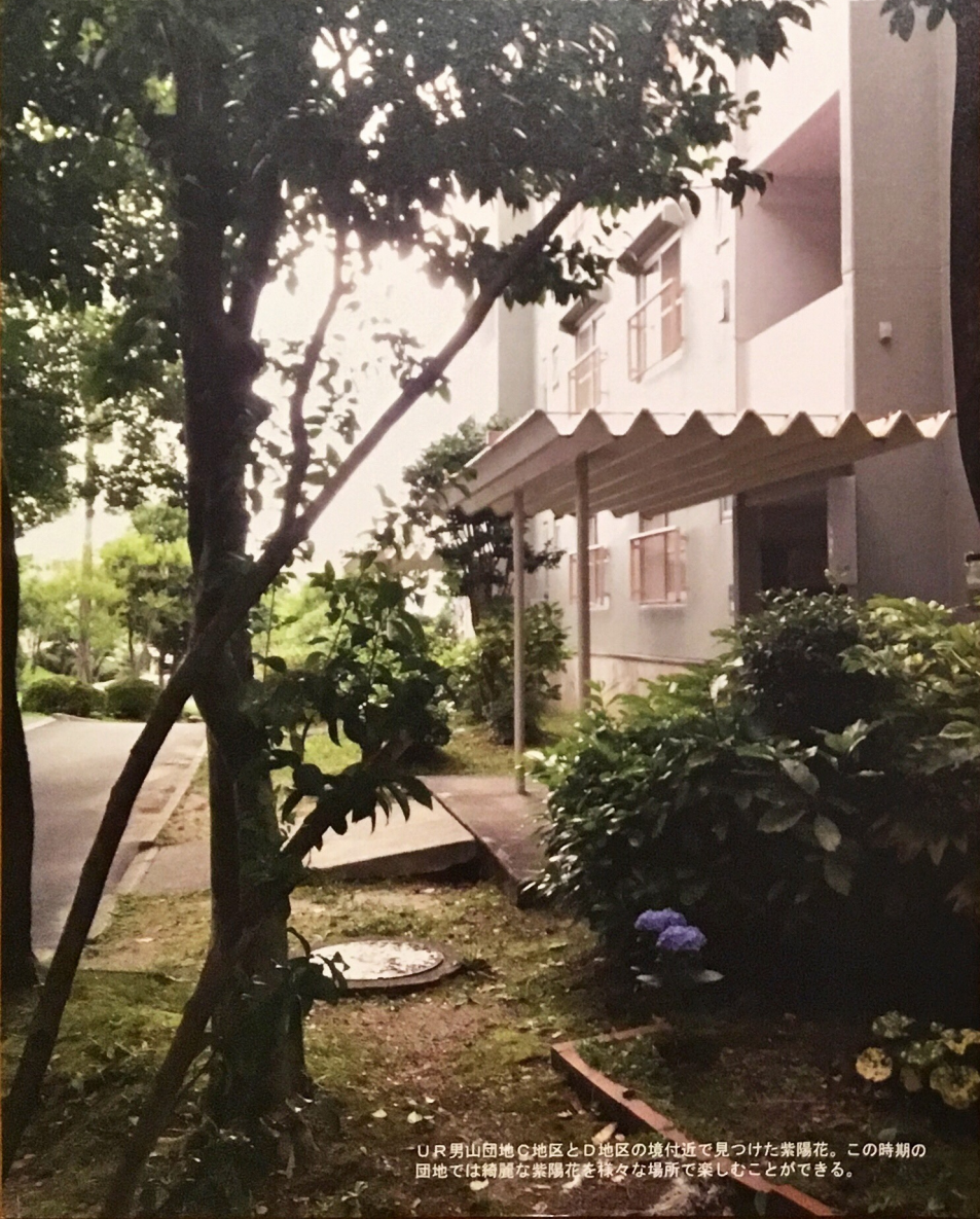
UR男山団地C地区とD地区の境付近で見つけた紫陽花。この時期の団地では綺麗な紫陽花を様々な場所で楽しむことができる。

だんだん通信は、365日オープンのだんだんテラスで起きている日々のできごとや地域の情報を発信する月刊誌です。