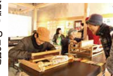
支援学校の生徒さんがラボで実演。授業ではコースター等の製品を製作しています。

毎週火・木曜日 10:30~11:30 に 京都八幡支援学校の生徒さんがさをり織りの実演・体験の場を開いています。さをり織りは、素材や織り方を自分の思いのままに織るといった理念があります。世界に1つだけのオリジナルを体験しにきてください!