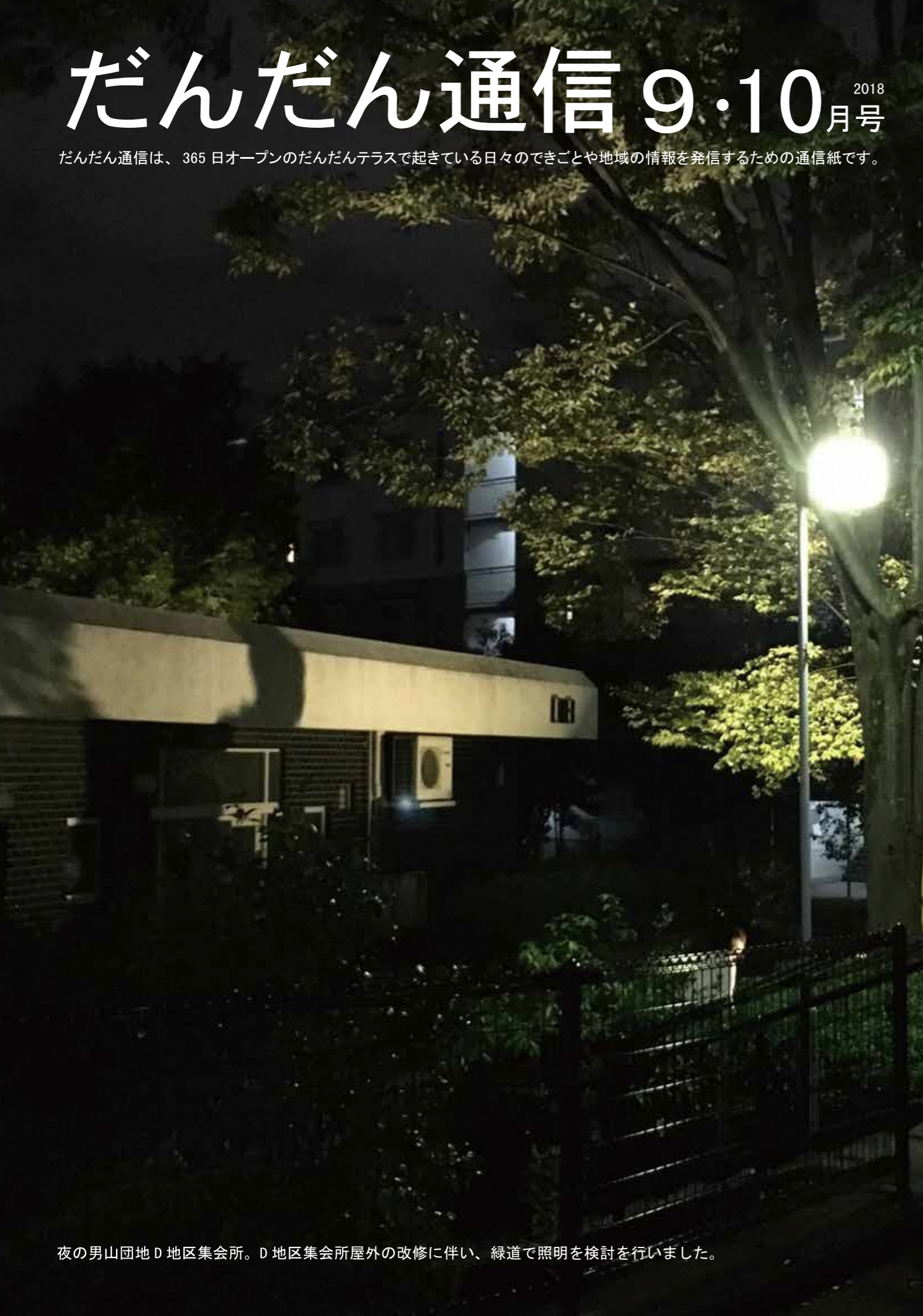
夜の男山団地D地区集会所。D地区集会所屋外の改修に伴い、緑道で照明を検討を行いました。

だんだん通信は、365日オープンのだんだんテラスで起きている日々のできごとや地域の情報を発信するための通信紙です。