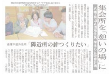
H30.10.27の京都新聞に掲載されました。