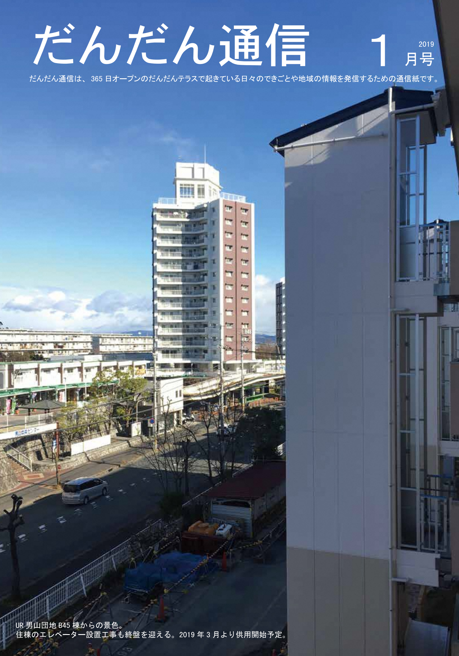
UR 男山団地 B45 棟からの景色。 住棟のエレベーター設置工事も終盤を迎える。2019年3月より供用開始予定。

だんだん通信は、365日オープンのだんだんテラスで起きている日々のできごとや地域の情報を発信するための通信紙です。