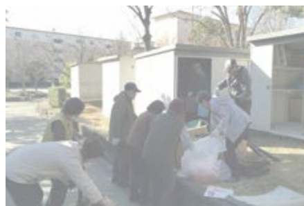
工事前に倉庫の物はみんなで片付けます。