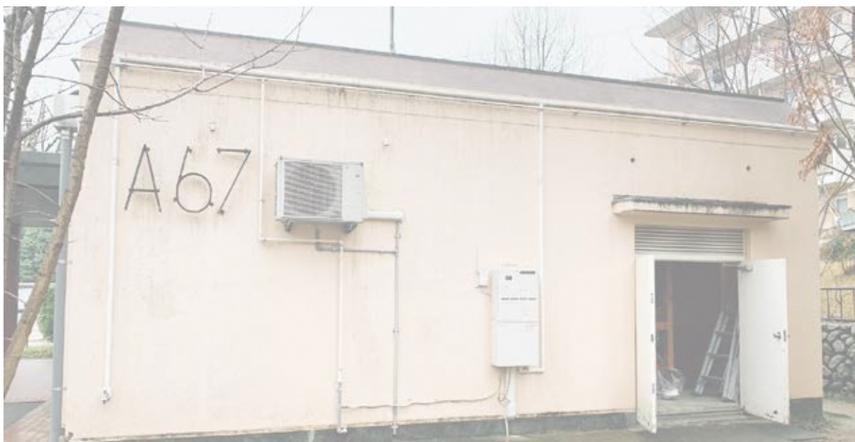
A地区集会所倉庫と外の小さな広場が一体で使えるような場所へデザイン。

男山団地初の試みとなる、住民協働型の集会所リノベーションプロジェクトをA地区で実践。今年の夏より、多様なメンバーで集会所の活用方法について話し合いを重ね、共同キッチンへ改修する計画となりました。3月末頃に完成予定です。