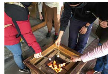
お芋やマシュマロを持参してきてくれる人も！

本格的な冬の到来に備え、DIY 囲炉裏をつくりました！ ラボで出てくる端材を燃料にして、せっせと灰をつくっています。 囲炉裏で暖をとっていると、どこからともなく人が集まります。