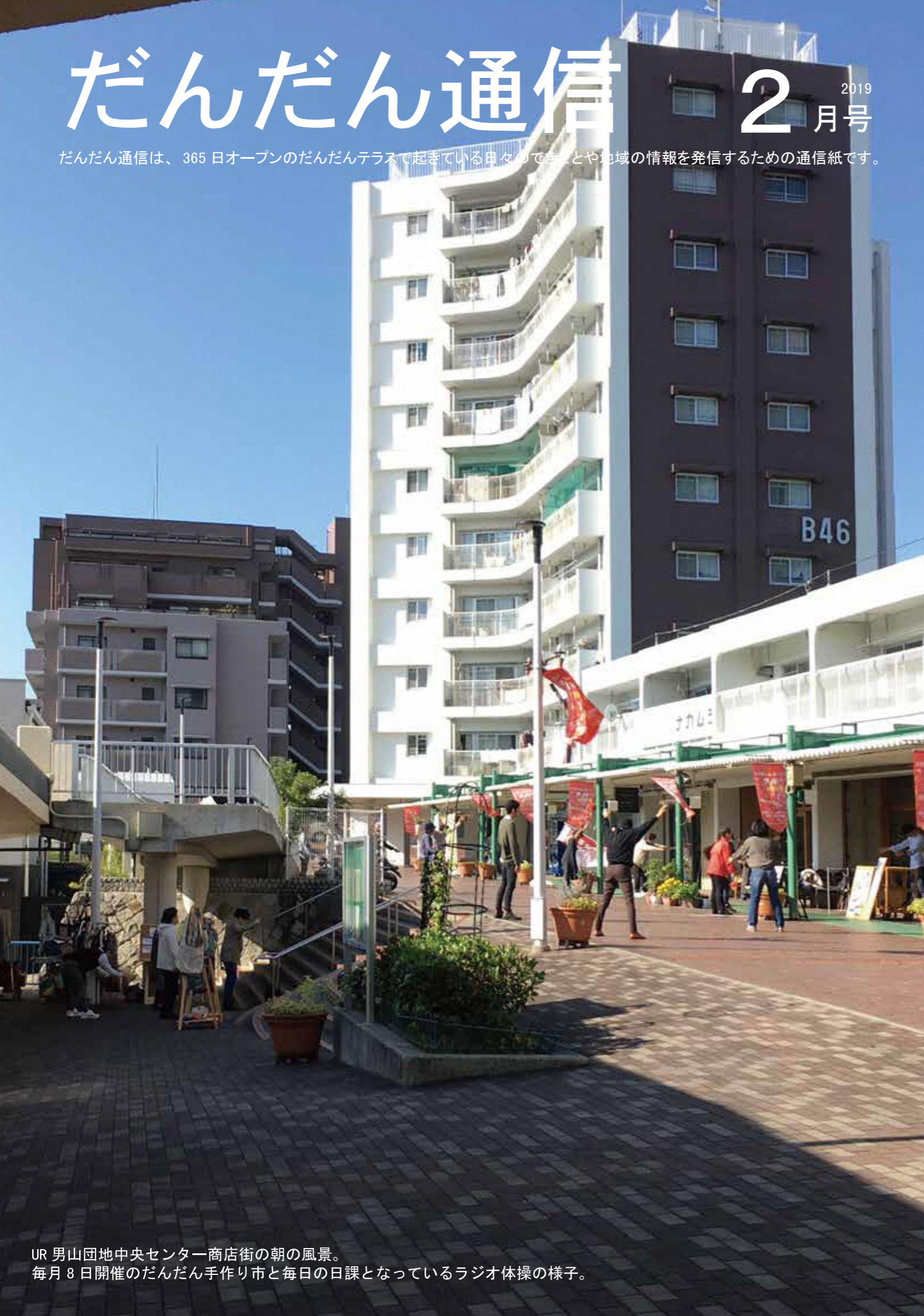
UR 男山団地中央センター商店街の朝の風景。 毎月8日開催のだんだん手作り市と毎日の日課となっているラジオ体操の様子。

だんだん通信は、365日オープンのだんだんテラスで起きている日々のできごとや地域の情報を発信するための通信紙です。