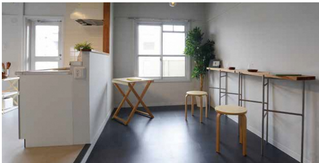
土間から広がる多様な住まい C09-403 人を迎えたり食事をしたり。暮らしに広がりを生む土間空間がポイントです。

今年度UR都市機構と関西大学団地再編プロジェクトにより設計したリノベーション住戸が完成し、2月末より入居者の募集を予定しています。今年度のリノベーションは、一部DIYもできる自由度の高い間取りが特徴。住まう人の好みに応じて、多様な暮らしが実現できる住まいを目指しました。