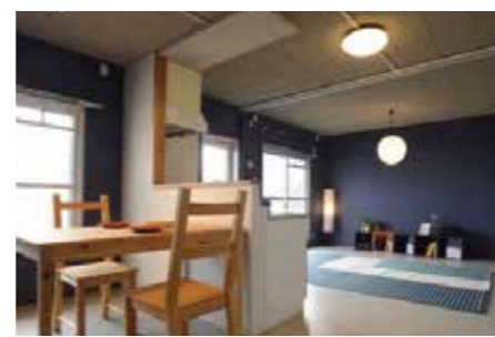
H30.10.27の京都新聞に掲載されました。

団地の緑道沿いに面した5階の住戸で、空や緑を感じることができる住まい。その風景を日々楽しめるように、南北の居室をつなぎ、伸びやかな“抜け”を作りました。周囲をあえて青色の壁とすることで、外の風景をより魅力的に映し出しています。