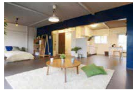
工事前に倉庫の物はみんなで片付けます。

既存の収納スペースや間仕切壁をなくして生まれた、広くて明るいワンルーム。自分好みに空間を作っていくことのできる自由度の高い間取りが特徴です。戸から見える外の風景はどの住戸よりも解放感に満ちています。