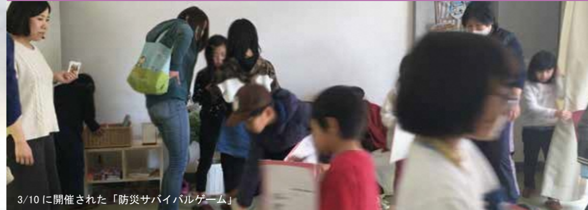
3/10に開催された「防災サバイバルゲーム」

住みたい、住み続けたい男山地域であるために、幅広い世代が集い、まちづくりについて話し合い、具体的な取組みを重ねる「男山やってみよう会議」4月で5年目を迎え新たにメンバーを募集します。詳細は中面、折り込みの記事を確認してください。