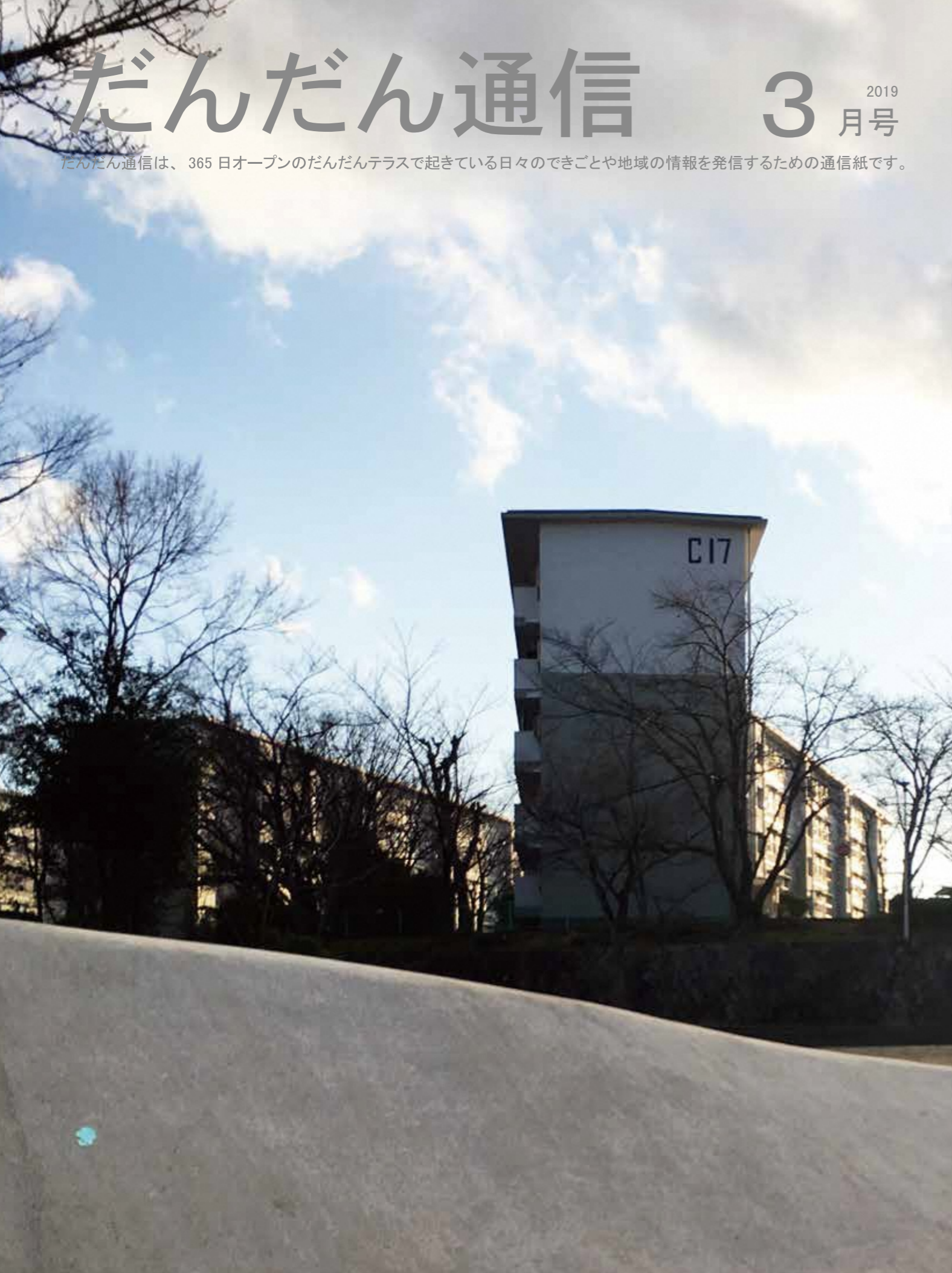
バルコニー鉄部などの塗装が進行しているUR 男山団地C地区。夕暮れ時に染まる住棟をお祭り広場から撮影。

だんだん通信は、365日オープンのだんだんテラスで起きている日々のできごとや地域の情報を発信するための通信紙です。