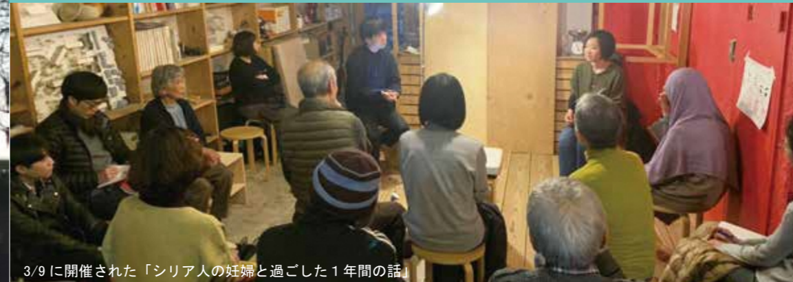
3/9に開催された「シリア人の妊婦と過ごした1年間の話」

「男山やってみよう会議」は、この4月で5年目を迎えます。これまで、計17のチームがこの会議から生まれました。毎月第3土曜日に開催する会議も50回を超え、いくつもの話し合いを重ねてきました。3月は「外国人支援」の取り組み、「防災」の取り組みが開催されました。どちらも大勢の参加者が訪れ、賑わいのあるイベントとなりました。毎月第3土曜日（4月のみ第4土曜日）にぜひご参加ください。