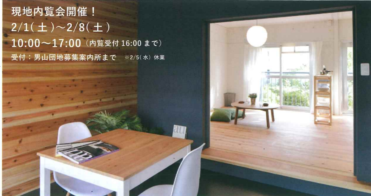
縁側のある住まい C15-107 型式：1R

今年度UR都市機構と関西大学団地再編プロジェクトにより設計したリノベーション住戸が完成し、2月9日に入居者の募集を予定しています。今年度のリノベーションは、昨年度に続き一部DIYもできる自由度の高い間取りに加え、新しく「1階住戸」でのリノベーションに挑戦。1階の良さを活かし、新しい暮らしが実現できる住まいを目指しました。