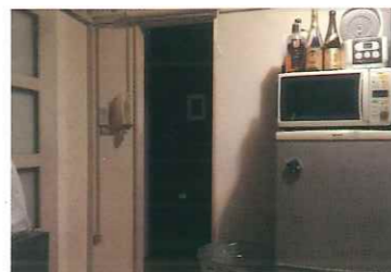
DIY住宅は、躯体を除く壁を解体することが可能。だんだんラボの電動工具を使い工事をしました。

DIY住宅なので、キッチンから和室につながる壁を大胆に解体しました! 廊下にでなくても、部屋と部屋を移動できるようになり、格段に使いやすくなりました!