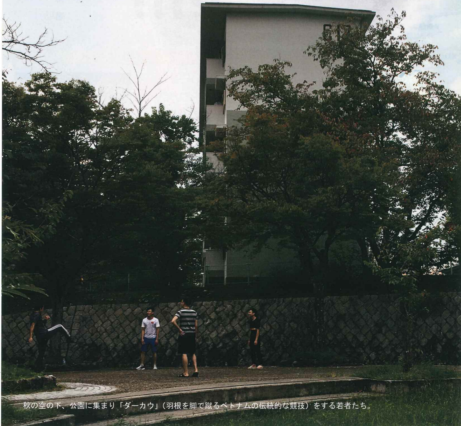
秋の空の下、公園に集まり「ダーカウ」(羽根を脚で蹴るベトナムの伝統的な競技)をする若者たち。

だんだん通信は、365日オープンのだんだんテラスで起きている日々のできごとや地域の情報を発信するための通信紙です。