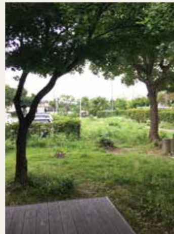
集会所デッキから撮影。駐車場側に細長い敷地があり、良い活用方法がないか検討中！

常駐をしている際、集会所の周辺のあまり使われていないスペースを見つけました。これからの活動の下準備として、このスペースを「耕す=(つかえる場所にする)」ことから始めていきます！