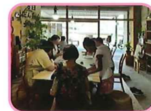
主催：イージーランゲージジャパニーズ