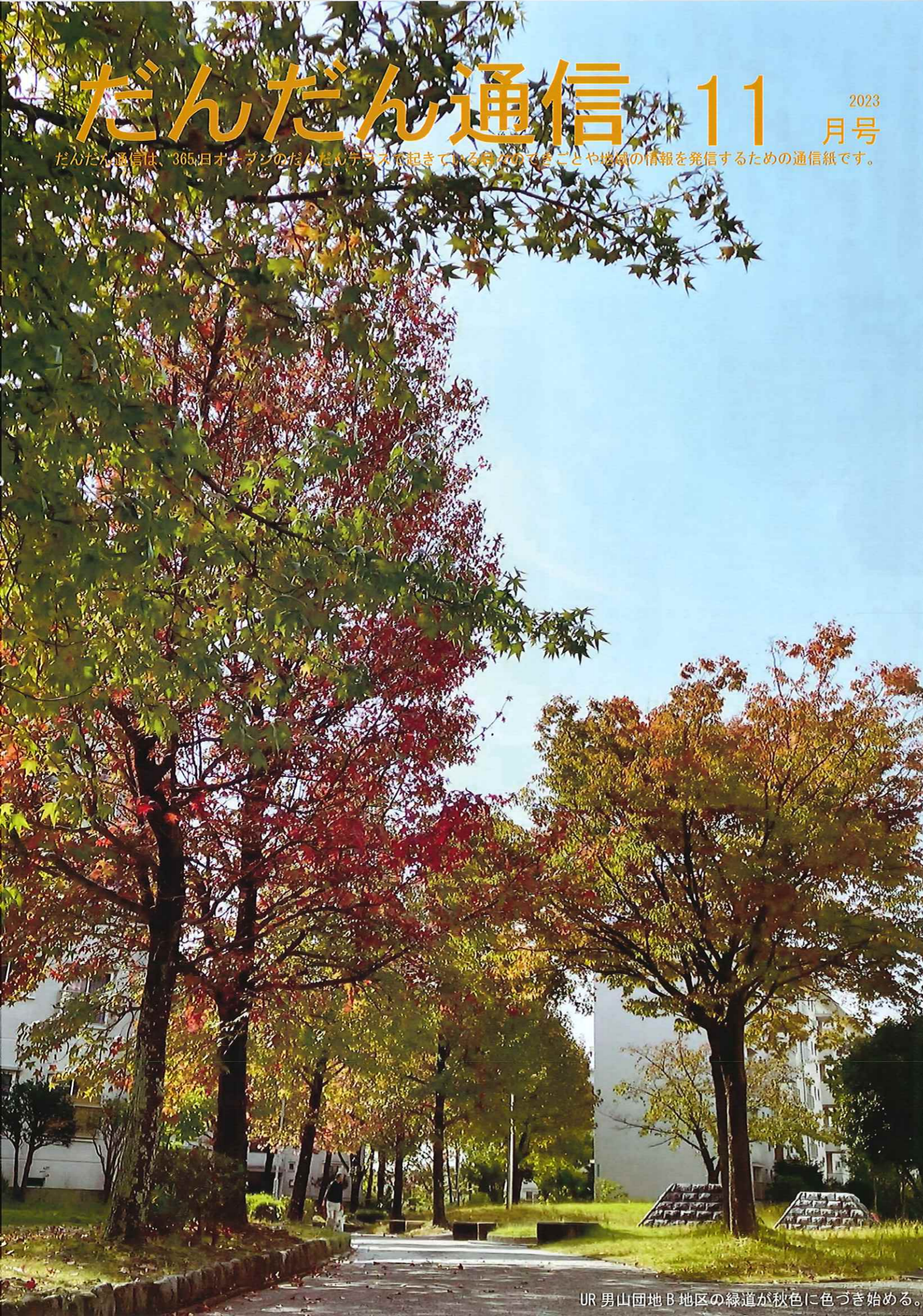
UR 男山団地B地区の緑道が秋色に色づき始める。

だんだん通信は、365日オーガニックのだんだんテラスで起きている様々なことや地域の情報を発信するための通信紙です。