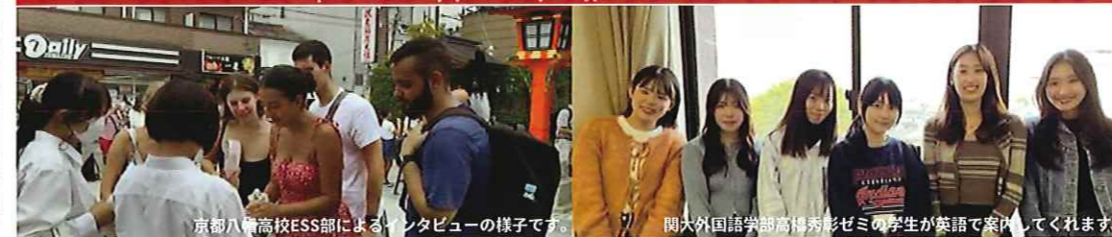
京都八幡高校ESS部によるインタビューの様子です。