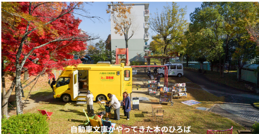
自動車文庫がやってきた本のひろば

11月30日(日)に男山団地C,D地区の緑道を活用した、緑道よりみちマルシェ in 男山を開催しました。当日は天気にも恵まれ、延べ400名近くがイベントに参加しました。それぞれの広場で催しが行われ、緑道を歩きながら楽しめる1日となりました。