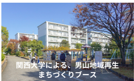
関西大学による、男山地域再生まちづくりブース