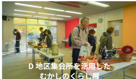
D地区集会所を活用したむかしのくらし展