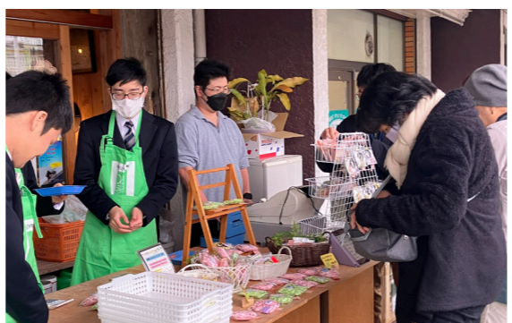
製品の販売を通して、対面コミュニケーションも学んでいます！

令和7年12月8日(月)のだんだん手作り市は、普段の手作り市に加えて、 京都府立八幡支援学校の生徒が制作した製品の販売 を行いました。準備段階ではだんだん手作り市の方から展示の仕方の工夫などを教えてもらいながら一緒に検討していました。当日は、手作り市の方だけでなく普段から作業実習を見守っていた方も来られ、 生徒たちは自分たちが制作した製品を喜んでもらう経験を通して自信を深めた様子 でした。