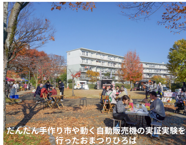
だんだん手作り市や動く自動販売機の実証実験を行ったおまつりひろば