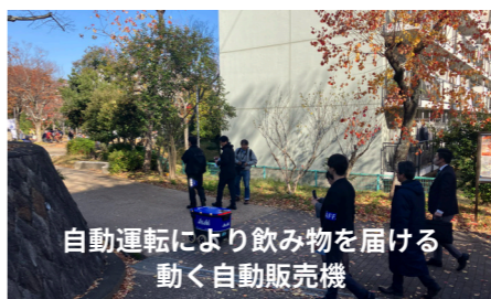
自動運転により飲み物を届ける動く自動販売機