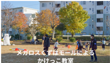
メガロスくずはモールによるかけっこ教室