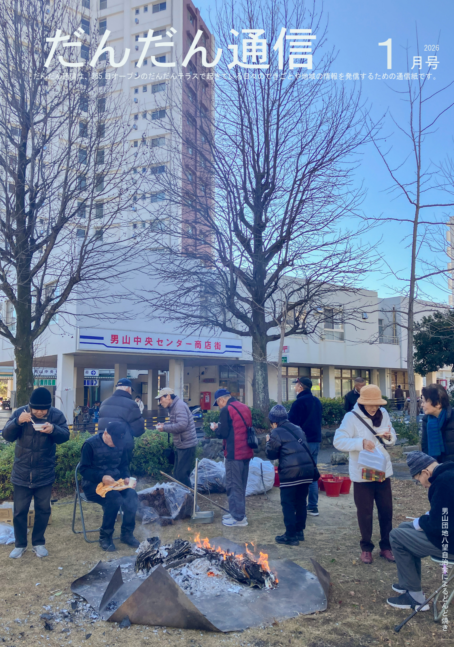
男山団地八望自治会によるどんど焼き

だんだん通信は、365日オープンのだんだんテラスで起きている日々のできごとや地域の情報を発信するための通信紙です。