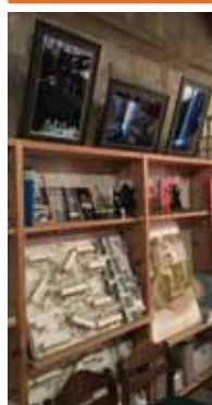
私の写真を飾っています。

昭和48年春、京都市内より男山団地へ来ました。夫婦子供2人の4人家族でした。翌年3男が生まれ5人家族となりました。以来40数年八幡市民として暮らしてきました。子供達は3人共男山四小、男山二中、八幡高校と歩いて10分以内の近距離通学で便利な場所でした。子供達が小、中学生の頃には男山四小には1500人を超える生徒が居て府内有数のマンモス校でした。その男山四小が40年後には廃校となり少子高齢化の波は想像できませんでした。団地内には老夫婦だけの家庭や一人暮らしの高齢者が大勢居るように思われます。高齢者の住みよい環境づくりをだんだんテラスのメンバーに期待しています。