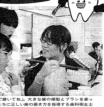
「奥まで磨いてね」。大きな歯の模型とブラシを使って子どもたちに正しい歯の磨き方を指導する歯科衛生士