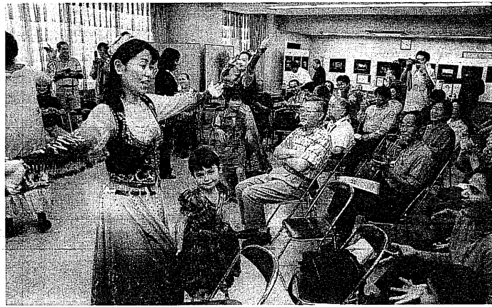
メッシュアップ。(みんなで踊りましょう)というウイグル族伝統の踊り。参加者も一緒に踊りの輪に入って楽しい時間を過ごしていました。