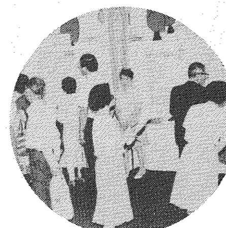
市民らでにぎわう「くらしのフェスティバル」