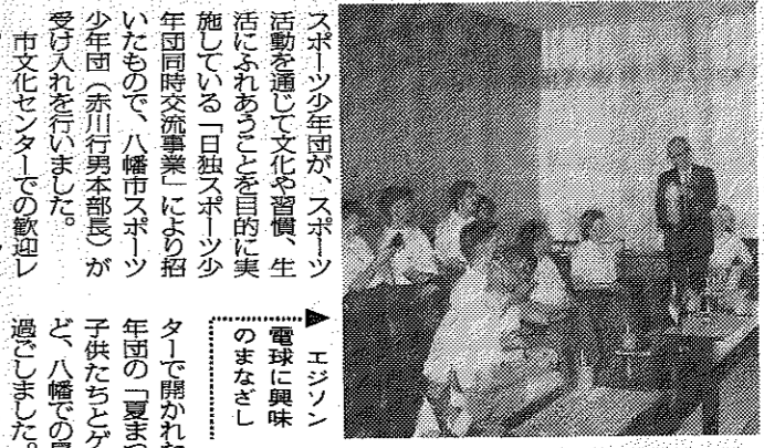
ホームステイ先でなごやかに回らん

ドイツのスポーツ少年団「夏まつり」にも参加 ドイツのスポーツ少年団「夏まつり」にも参加 ドイツのスポーツ少年団「夏まつり」にも参加