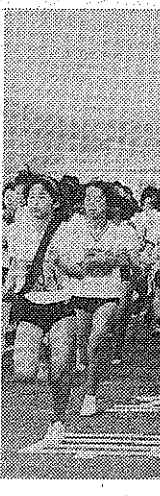
声援を背に元気にスタートする児童ら

「第9回八幡小学校駅伝大会」が、2月28日、八幡小学校で開かれた。大会は、八幡小学校、南山小学校、八幡中学校の3校が参加し、南山小学校が優勝した。