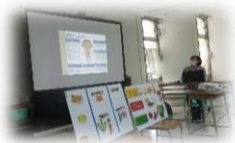
子どもの栄養と食について