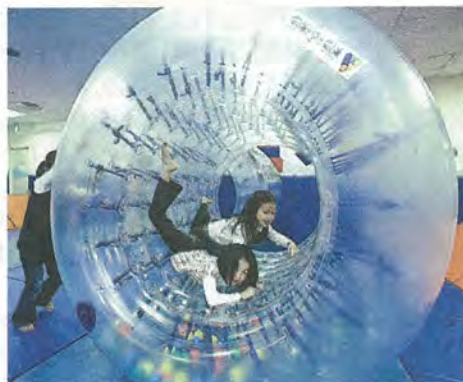
サイバーホイール

紙をすくすくの杜または、あいあいポケットの窓口へ提出。 受け付け 10月7日(水)から受け付け、定員になり次第締め切ります。 その他 動きやすい服装でお越しください。希望日にそえない場合がありますので、ご了承ください。 ◆問い合わせ 子ども・子育て支援センター すくすくの杜(☎972-1085)