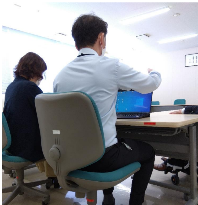
書記担当の社員のフォローを受けながら打ち合わせを行う C さん（右）

現在は、心身共に良好な状態で業務を継続しています。管理職として部下から厚い信頼も寄せられています。職務遂行能力も着実に回復しており、会社としては、引き続き状況を見ながら適切に合理的配慮を講じていく考えです。