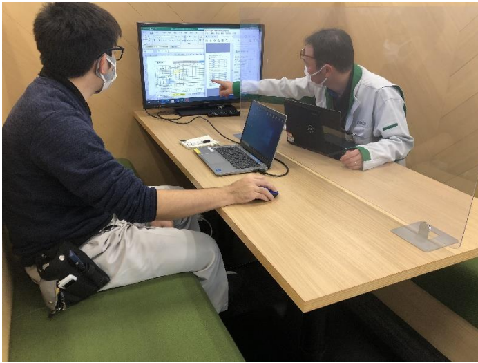
直属のチームリーダーと 数値データの確認作業を 行うDさん（左）