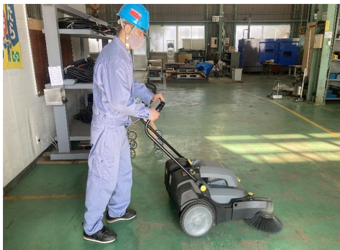
手押し式の床掃除機（スイーパー）を使って工場内清掃を行う A さん