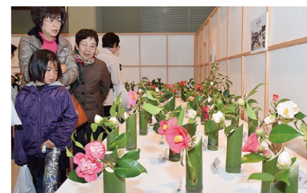
松花堂つばき展 Camellia Exhibition at Shokado Garden 3月下旬～4月上旬に開催される松花堂庭園の春の風物詩。一輪挿しや盆栽、フラワーアートなど、つばきが趣向を凝らして飾られます。