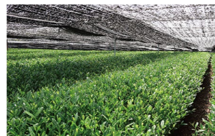
碾茶(てんちゃ) Leaves of powdered green tea 木津川沿いで栽培されている抹茶の原料となる茶葉(浜茶)。緑色が濃く、苦みや渋みがない優しい甘さの最高級の茶葉です。