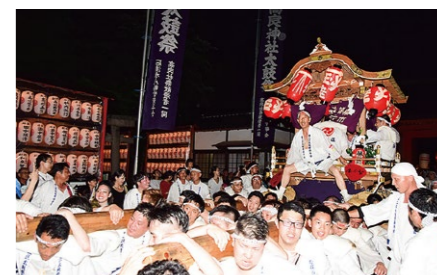
太鼓まつり Drum Festival 7月に行われる高良神社例祭の宵祭。屋形太鼓の担ぎ手たちが、太鼓の音に合わせて「ヨッサー、ヨッサー」と威勢の良い掛け声を上げながら、町内を勇壮に練り歩きます。