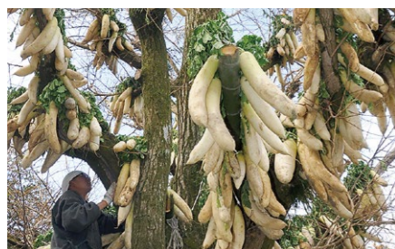
大根干し Hanging out radishes 円福寺の修行僧たちが、托鉢先から寄せられた1000本以上の大根を数日かけてイチョウの木に干します。干した大根はたくあんにされ、春と秋に行われる万人講で精進料理として参拝客に振る舞われます。