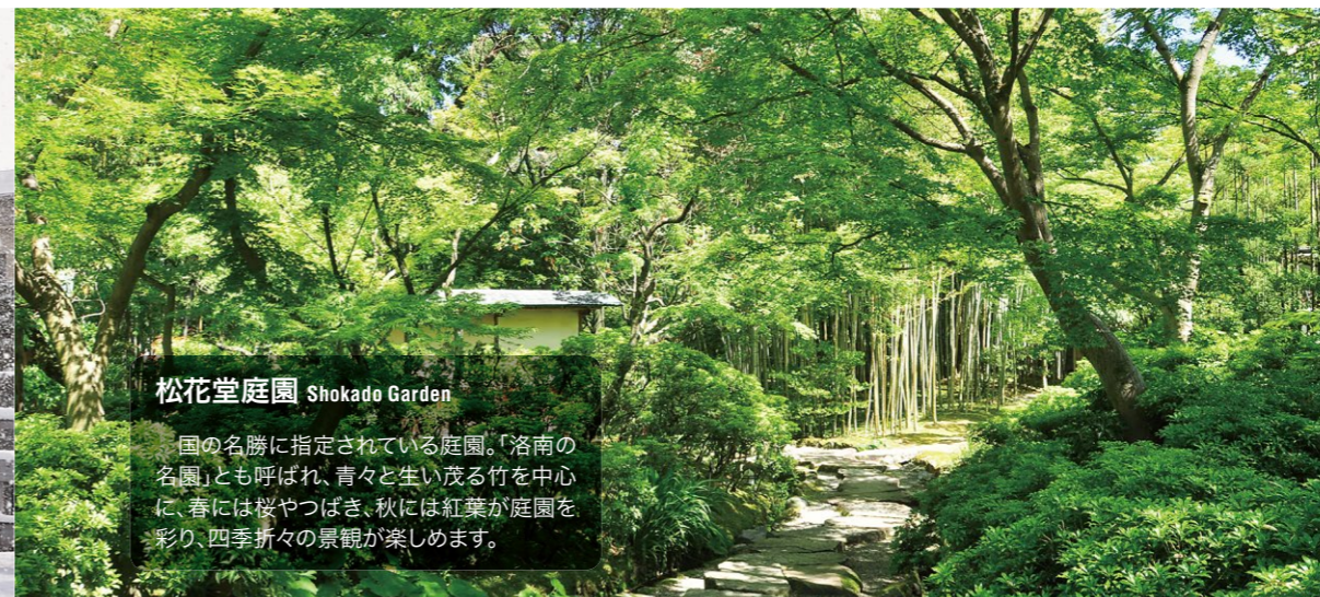
松花堂庭園 Shokado Garden 国の名勝に指定されている庭園。「洛南の名園」とも呼ばれ、青々と生い茂る竹を中心に、春には桜やつばき、秋には紅葉が庭園を彩り、四季折々の景観が楽しめます。