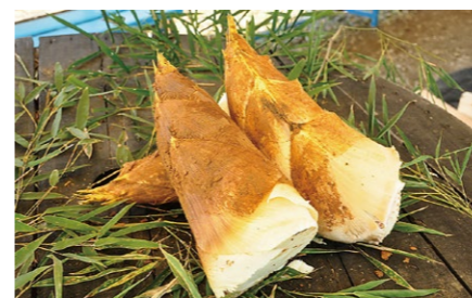
筍 Bambooshoot 八幡市の代表的な特産品。そのほとんどが孟宗竹の筍で、肉厚でえぐみがなく、柔らかくて甘みがあります。