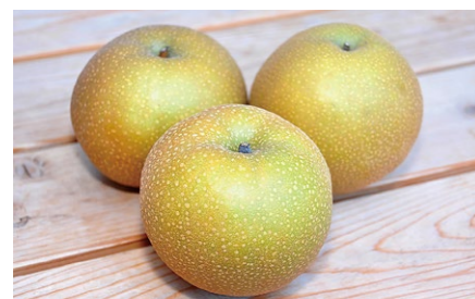
梨 Pear 初秋を伝える新鮮な甘さと香りを楽しめる梨。品種は「幸水」「豊水」が中心で、果肉が柔らかく多汁なのが特徴です。