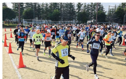
八幡市民マラソン大会 Yawata citizen marathon ハーフマラソンや親子部門など、全15部門で行われるマラソン大会。市内外から1500人以上のランナーが集まり、八幡のまちを駆け抜けます。