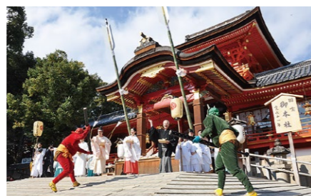
鬼やらい神事 Oniyarai / The event to chase off the demons 石清水八幡宮の節分行事。鬼やらい人を始め、年男や年女たちが「鬼やろう」の掛け声とともに福豆を撒き、境内に現れた鬼たちを退散させます。