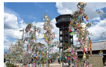
七夕まつり Tanabata Festival 旧暦の七夕の時期に背割堤で開催されるイベント。灯籠や短冊を結んだ笹が飾り付けられた会場で、さまざまな催しを実施しています。