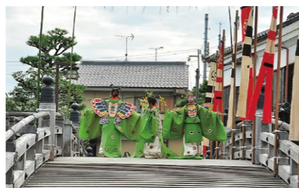
石清水祭 Iwashimizu Festival 9月15日に行われる三大勅祭の一つ。真夜中、約500人の神人が山を下り、山麓の頓宮で儀式を執り行う姿は、平安絵巻から飛び出してきたかのようで、「動く古典」とも言われています。