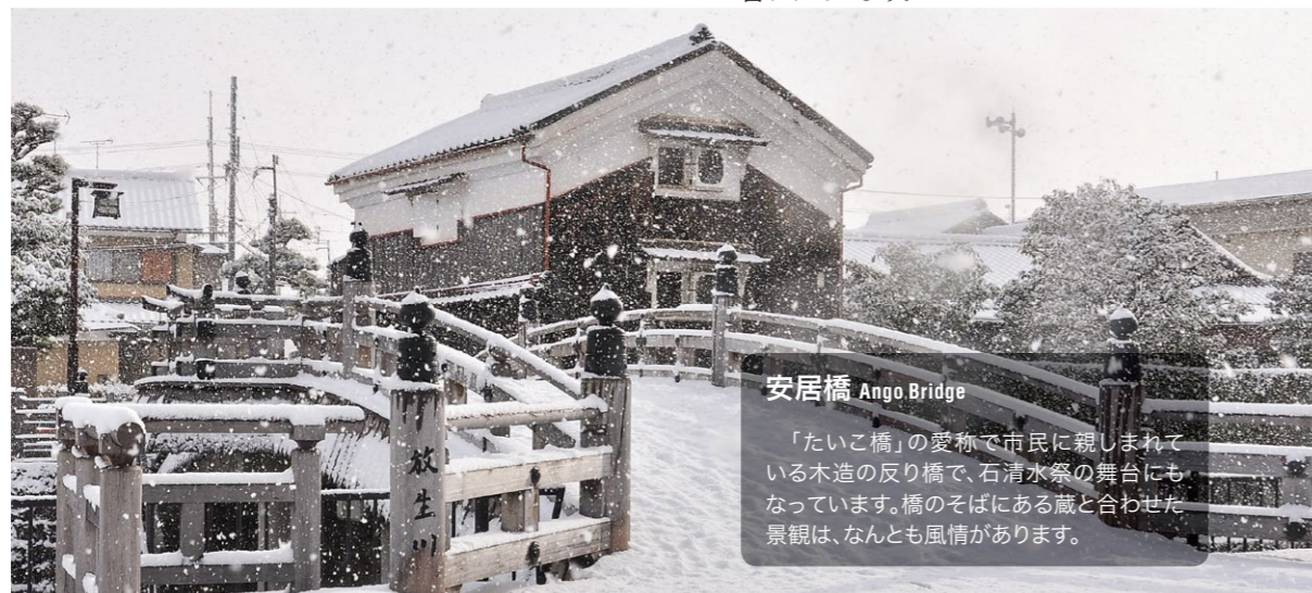
安居橋 Anjo Bridge 「たいこ橋」の愛称で市民に親しまれている木造の反り橋で、石清水祭の舞台にもなっています。橋のそばにある蔵と合わせた景観は、なんとも風情があります。