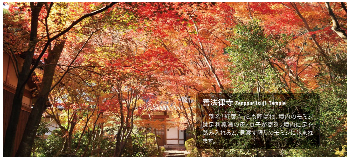
善法律寺 Zempouritsuji Temple 別名「紅葉寺」とも呼ばれ、境内のモミジは足利義満の母、良子が寄進。境内に足を踏み入れると、見渡す限りのモミジに包まれます。