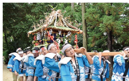
ずいきみこし Zuikimikoshi ズイキ(サトイモの茎)で屋根をふき、その年に収穫された約30種類の野菜が飾り付けられたみこし。10月、収穫への感謝と五穀豊穡を願って上奈良区内を巡行します。