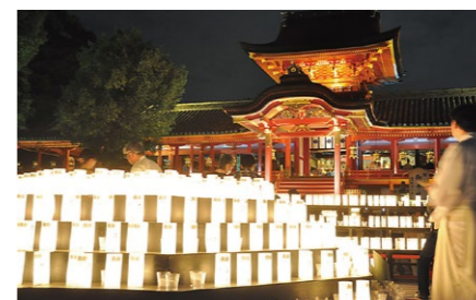
石清水灯燎華 Iwashimizu Touryouka 例年5月4日に開催される石清水八幡宮のライトアップイベント。境内が石灯籠や献灯の明かりでともされ、幻想的な雰囲気に包まれます。