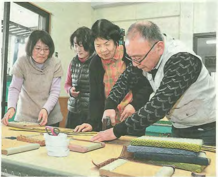
店の人(右から1人目と3人目)に教わりながら豆たたみを作る参加者たち

第一回得する街のゼミナール「まちゼミin八幡」が2月1日から28日まで開催され、32の市内商店などの店主らが講師となり、参加者たちに専門知識などを伝授しました。