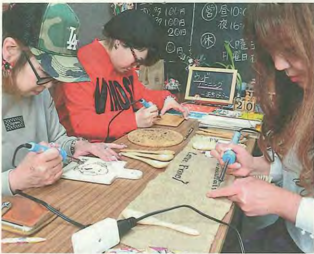
はんだごてでイラストを焼き付ける参加者と店の人(右)

第一回得する街のゼミナール「まちゼミin八幡」が2月1日から28日まで開催され、32の市内商店などの店主らが講師となり、参加者たちに専門知識などを伝授しました。