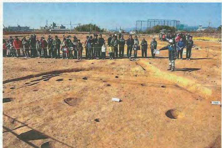
竪穴建物跡を見学する参加者たち(2月2日)

また、多数の土馬やひさご(ひょうたん)形土製品なども出土。ひさご形土製品は、同遺跡の東方に位置する「美濃山廃寺」でしか出土していないことから、同センターの職員は「工人たちが美濃山廃寺の造営に関わったのではないか」と見解を説明するなどし、参加者たちは熱心に話を聞きながら、当時の暮らしに思いをはせていました。