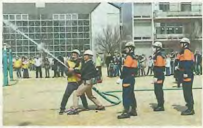
昨年の防災訓練の様子

災害時に円滑に避難できるようにするため、積極的に参加し、防災行動力を高めましょう。