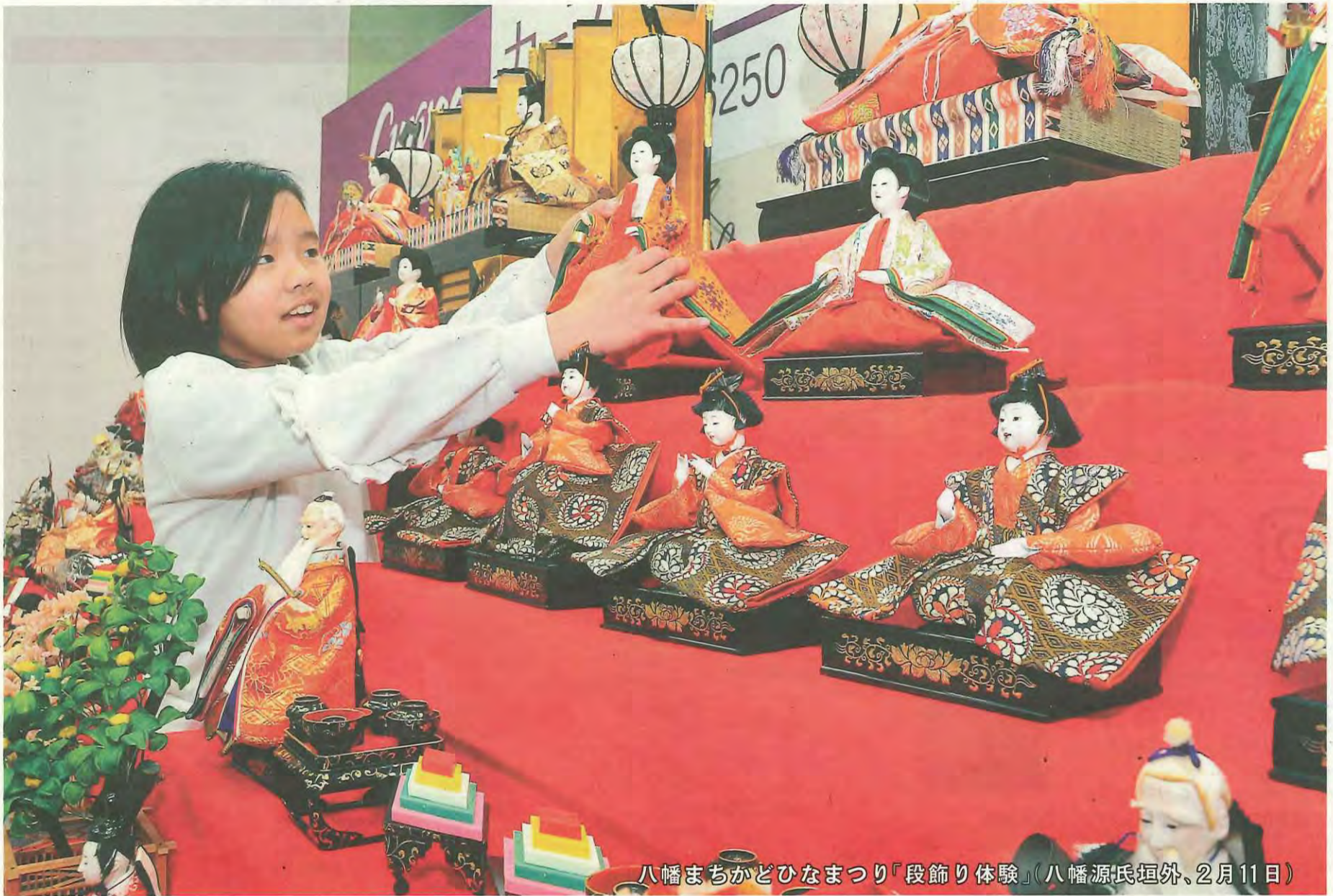
八幡まちなかどひなまつり「段飾り体験」(八幡源氏垣外、2月11日)