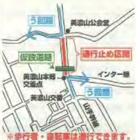
※歩行者・自転車は通行できます。