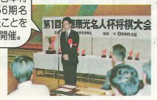
第1回佐藤康光名人杯将棋大会開催。盤上で熱戦を繰り広げ 1回休み