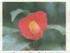
市の花木として「つばき」を制定