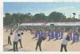
健康フェスタ初開催。たくさん体を動かし 1マス進む