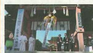
石清水八幡宮本社10棟等が市内初の国宝に指定。市内がお祝いムードに包まれ、もう 1回サイコロをふる