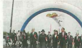
市の表玄関「新木津川御幸橋」開通。「橋も永続してほしい」と願いを込め、3世代夫婦が渡り初め。