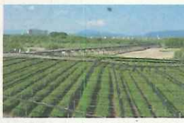
本市を含む山城地域8市町村の構成文化財が日本遺産に認定(「日本茶800年の歴史散歩～京都・山城～」)