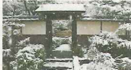
松花堂および書院庭園が名勝に指定。18年ぶりに京都府南部に大雪警報が発令され、市中が銀世界に。 1回休み