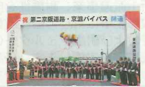
第二京阪道路(巨椋池IC-枚方東IC)開通。市内初のICから高速に乗って 2マス進む