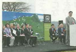
「さくらであい館」がオープン。お茶の京都博オープニングイベント「さくら茶会」開催。お茶を味わいながら散策し、 1マス進む