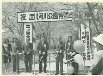
「平成」の始まりとともに、八幡さくら堤公園(淀川河川公園背割堤地区)オープン

平成3年(1991年) 男山文化ホール・男山市民図書館開館。読書に夢中になって 1回休み