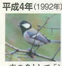
市の鳥として「シジュウカラ」を制定

平成3年(1991年) 男山文化ホール・男山市民図書館開館。読書に夢中になって 1回休み