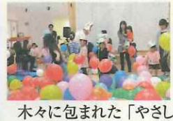
木々に包まれた「やさしい森」をイメージした、子ども・子育て支援センター「すくすくの杜」が開館