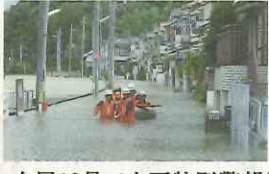
台風18号で大雨特別警報発表。市内で床上・床下浸水等2年連続被害を受け 1回休み