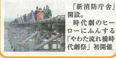
「新消防庁舎」開設。時代劇のヒーローにふんする「やわた流れ橋時代劇祭」初開催