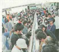
市制施行30周年。記念して、30mのサバズシ作りに挑戦。おなががいっぱいで 1回休み