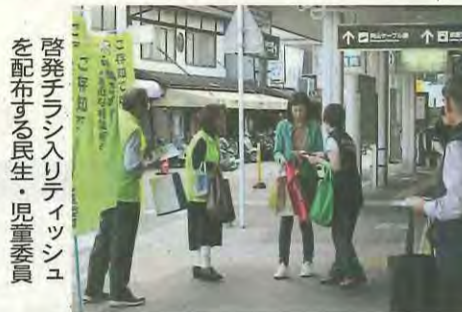
啓発チラシ入りティッシュを配布する民生・児童委員

民生・児童委員は、地域の福祉全般に関する困りごとや心配ごとの相談を受け、助言や援助を行います。そのほか市役所や福祉機関などと連絡調整し、地域住民が適切な福祉サービスを受けられるようつなぎ役として活動します。