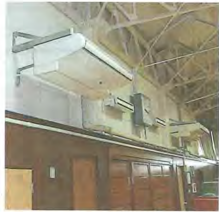
男山第三中学校武道場内の空調設備

仕様は、都市ガスを燃料とする自立運転機能付ガスヒートポンプ方式。都市ガスの供給が停止した際にも運転が可能となるよう、ガス変換装置を用いてプロパンガスも使用することができ、避難所生活の健康管理にも役立てることが出来ます。