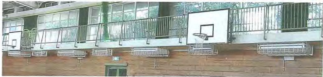
男山第二中学校体育館内の空調設備