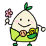
やわたん (八幡市健康部)