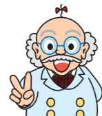
物知り爺さん (八幡市環境市民ネット)