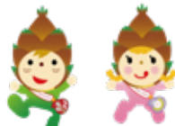
タケちゃん ノコちゃん (八幡市観光協会)