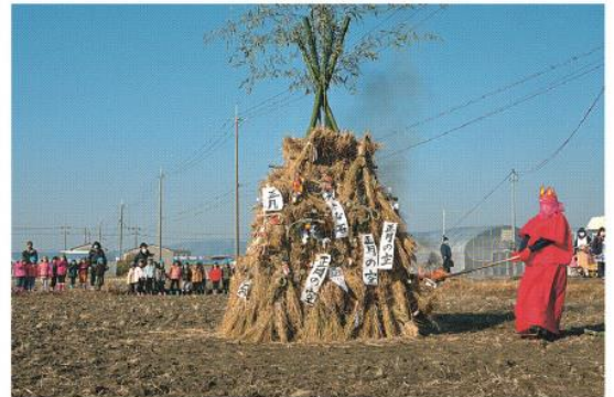
やぐらに火をつける火の神様と見つめる園児たち

竹で組んだやぐらに正月飾りや書初めなどを掛けて焼く「とんどさん」が1月13日、有都こども園そばの田んぼで行われ、同園の園児たちが今年1年の健康などをお祈りしました。 田んぼに集まった園児たちが大きな声で「火の神様ー」と呼ぶと、火の神様が登場し、手に持ったたいまつでやぐらに火をつけました。 やぐらは煙をあげながら勢いよく燃え上がり、「ボンッ、ボンッ」と竹が弾ける大きな音が周囲に響きました。園児たちはその様子を見つめながら、新型コロナウイルスに負けずに健康で元気に過ごせますようにと、手を合わせてお祈りしていました。