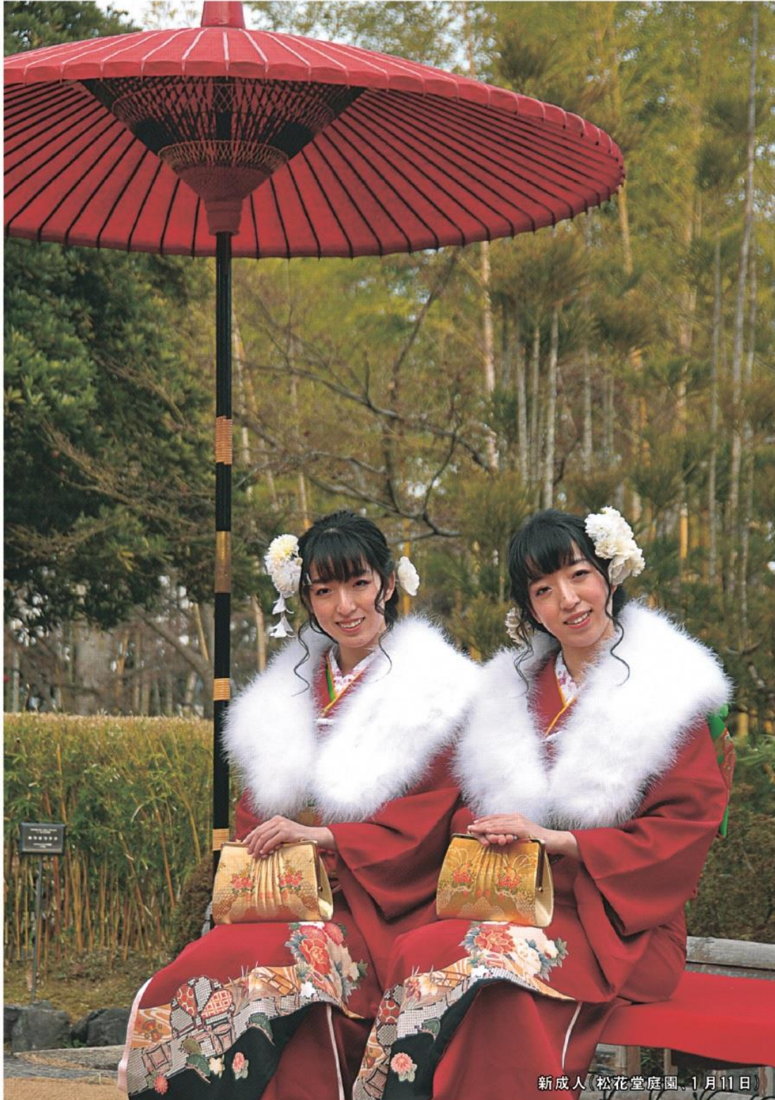
新成人(松花堂庭園、1月11日)