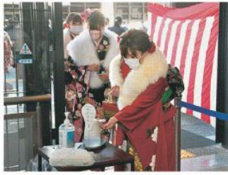
会場入り口でアルコール消毒をする新成人

午前と午後の一部に分けて開催。会場入り口での手指のアルコール消毒や検温など、感染対策を徹底して実施しました。