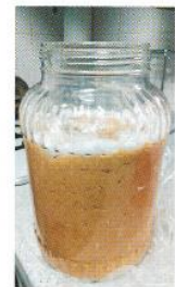
仕込みが完了したみそ