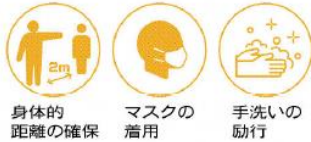
身体的距離の確保 マスクの着用 手洗いの励行

家庭内にウイルスを持ち込まないため、マスク着用のほか、外出などから帰宅した際は、すぐに手洗い・うがいを行うなど、基本的な感染対策を徹底してください。ご協力をお願いします。