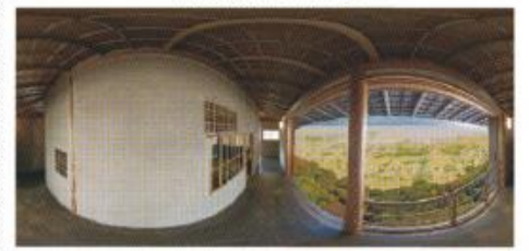
VR動画で閑雲軒の様子を再現

景を多層的に紹介し、識者たちが空中茶室に思いを巡らせ、語られる内容となっています。ぜひご覧ください。