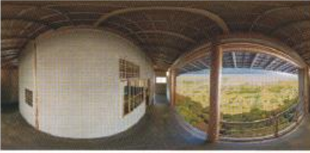
VR動画で閑雲軒の様子を再現

景を多層的に紹介し、識者たちが空中茶室に思いを巡らせ、語られる内容となっています。ぜひご覧ください。