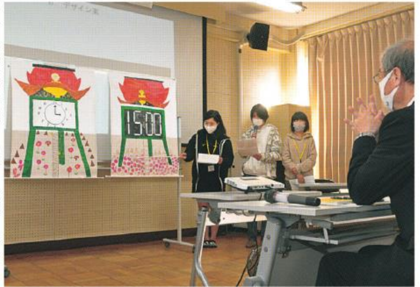
市の特色を詰め込んだ時計の制作を提言する小学生班

市内の小・中学生、高校生30人がまちをより良くするアイデアを考える「八幡市子ども会議」の市長への提言が1月30日、福祉会館で行われました。 同会議は、立命館大学政策科学部稲葉ゼミと連携して平成16年から毎年実施。今年度はコロナ禍のため、リモートで打ち合わせを実施するなど、対策をとり