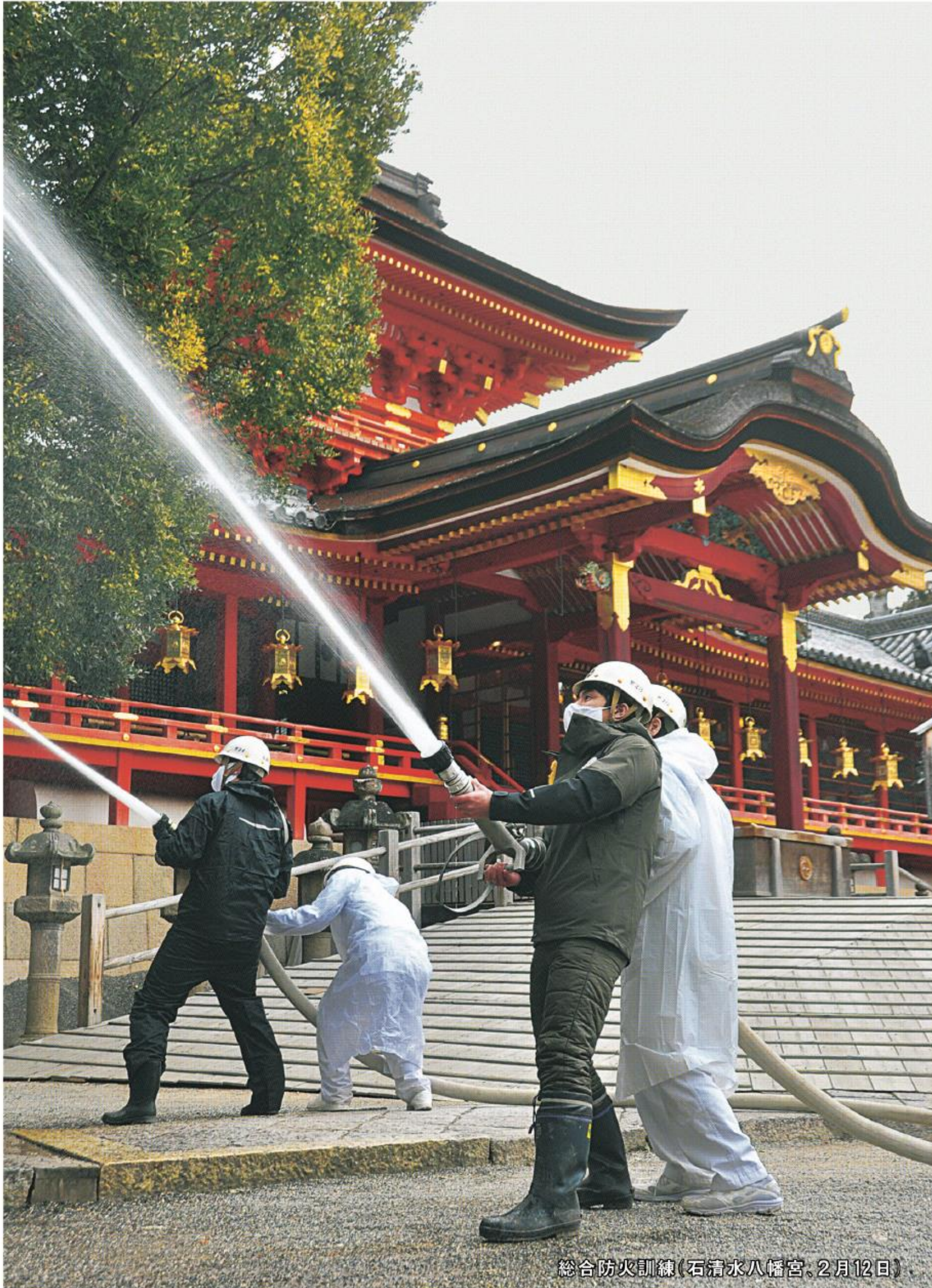
総合防火訓練(石清水八幡宮、2月12日)