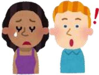
がいこくじん 外国人