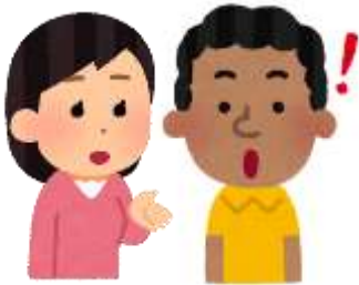
となり ひと 隣の人