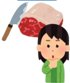
がいこくじん 外国人

わたし くに そと りょうり 私の国では、外で料理を するのはふつうです。なぜ？