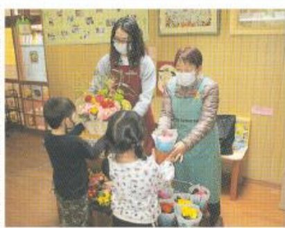
児童に花を手渡す民生・児童委員

【調査】地域内の高齢、障がい、母子、父子など、福祉問題を抱えている世帯の有無や、その世帯のニーズの把握