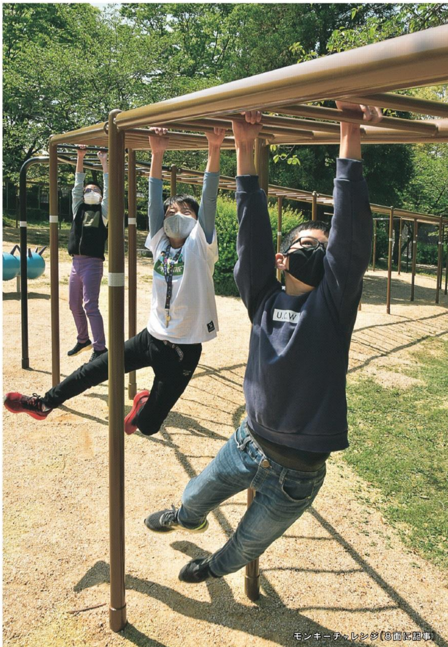
モンキーチャレンジ(8面に記事)