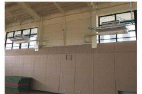
男山中学校武道場内の空調設備

男山中学校については、都市ガスの供給が停止した際にも運転が可能となるよう、ガス変換装置を用いてLPガスも使用することができます。