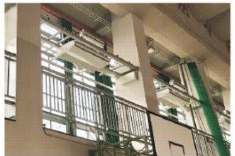
男山東中学校体育館内の空調設備