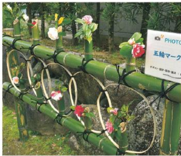
オリンピックマークがデザインされた花器

4月2日～4日の3日間、松花堂庭園で「第32回松花堂つばき展」が開催され、約750人の来場者が、庭園に自生するツバキや約300種の切り花の展示を楽しみました。