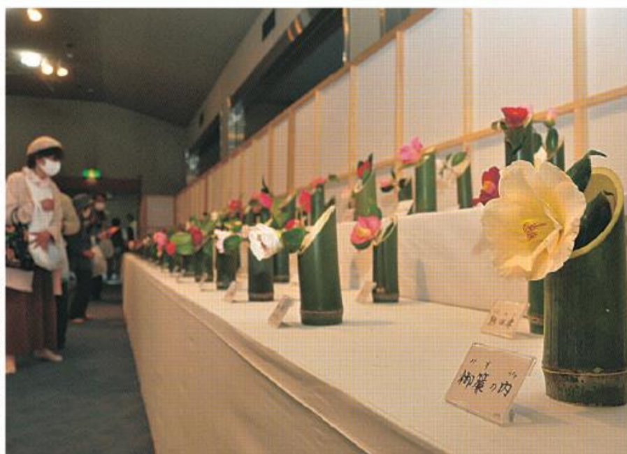
さまざまなツバキの一輪挿しを鑑賞する来場者

4月2日～4日の3日間、松花堂庭園で「第32回松花堂つばき展」が開催され、約750人の来場者が、庭園に自生するツバキや約300種の切り花の展示を楽しみました。