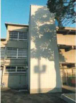
中央小の校舎に設置したエレベーターと外観