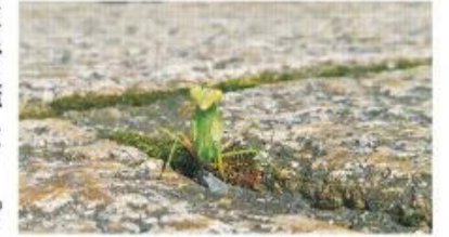
昨年度の大賞作品

賞 入賞者(9人)には図書カード、大賞受賞者には図書カードと図鑑「やわたのまちの小さな仲間たち2016」を贈呈、応募者全員に参加賞をプレゼントします。