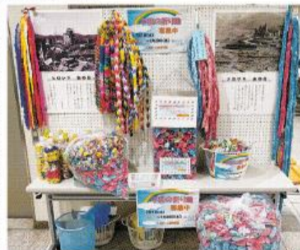
昨年寄せられた折り鶴

市とピース八幡(八幡市非核平和都市推進協議会)は、7月1日(木)から29日(木)まで、平和の願いを込めて折った「平和の折り鶴」を募集します。