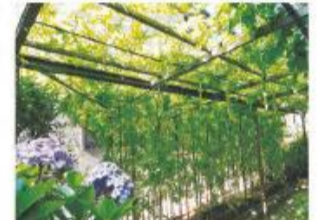
昨年度の やわたみどり大賞作品

対象 市内の一般家庭、学校および事業所等で、令和3年に生育した植物による緑のカーテン