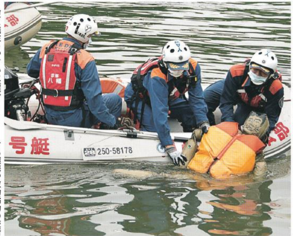
水難者に見立てた人形を救助する隊員たち

夏に発生しやすい水難事故に備えるため、消防本部が6月14日～30日、宇治川御幸橋付近で水難救助訓練を行いました。同訓練は、水難現場にお