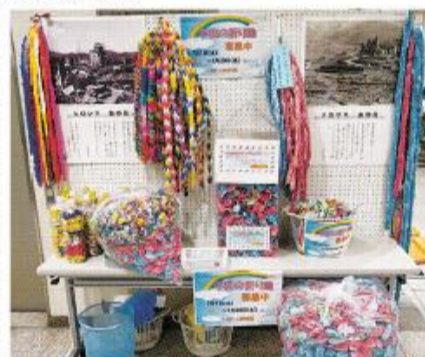
昨年寄せられた折り鶴

市とピース八幡(八幡市非核平和都市推進協議会)は、7月1日(木)から29日(木)まで、平和の願いを込めて折った「平和の折り鶴」を募集します。