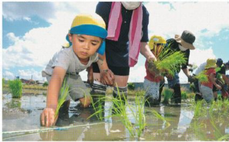
丁寧に苗を植える園児たち

6月17日、有都こども園の4、5歳児37人が、内里蜻蛉尻の田んぼで田植えを体験しました。同体験は、稲の苗植えから収穫までを通じて園児たちに食糧物の大切さを知ってもらおうと、地元農家の協力を得て毎年実施しています。はじめに、園児たちは農家の人に実際の苗を見せてもらい、いつも食べているお米がどのように作られるのかを勉強。苗が成長して稲になり、その実がお米になるなどの説明を熱心に聞き入っていました。