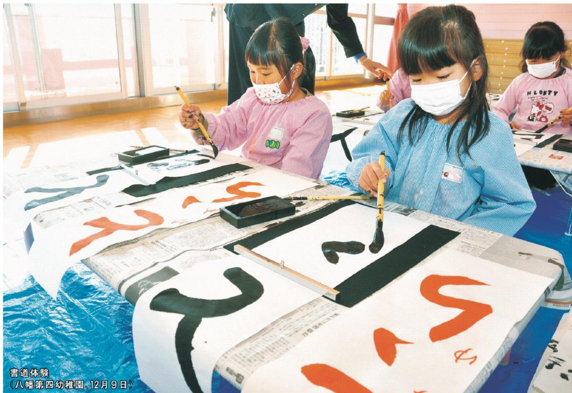
書道体験 (八幡第四幼稚園、12月9日)