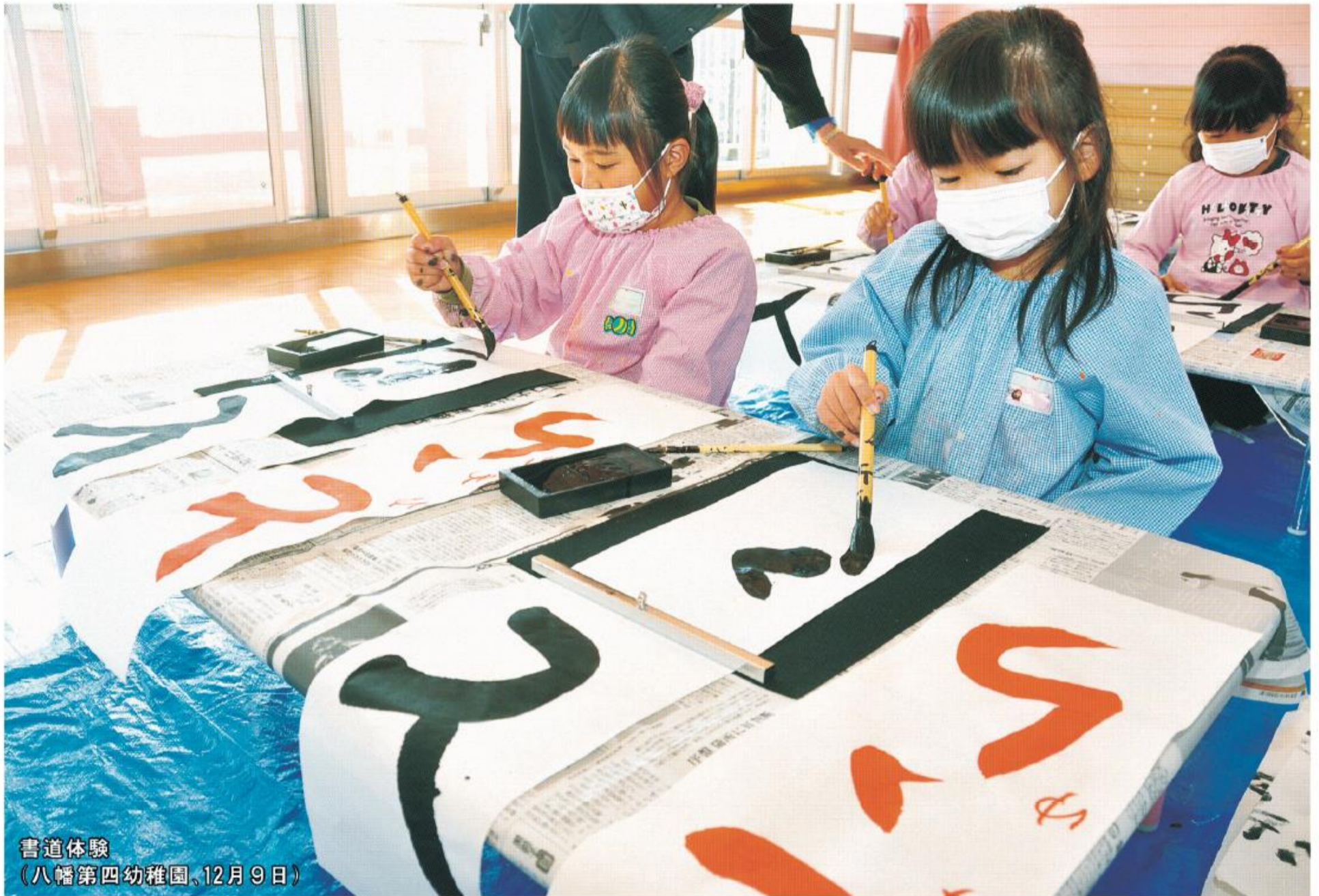
書道体験 (八幡第四幼稚園、12月9日)