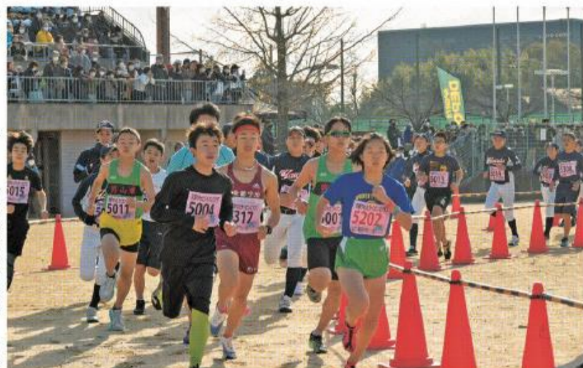
息を弾ませ駆けるランナー

12月5日、「2021八幡市民マラソン大会」が市民スポーツ公園を発着点に開催され、参加した573人のランナーが木津川左岸堤防や上津屋工業団地などのコースを力走しました。