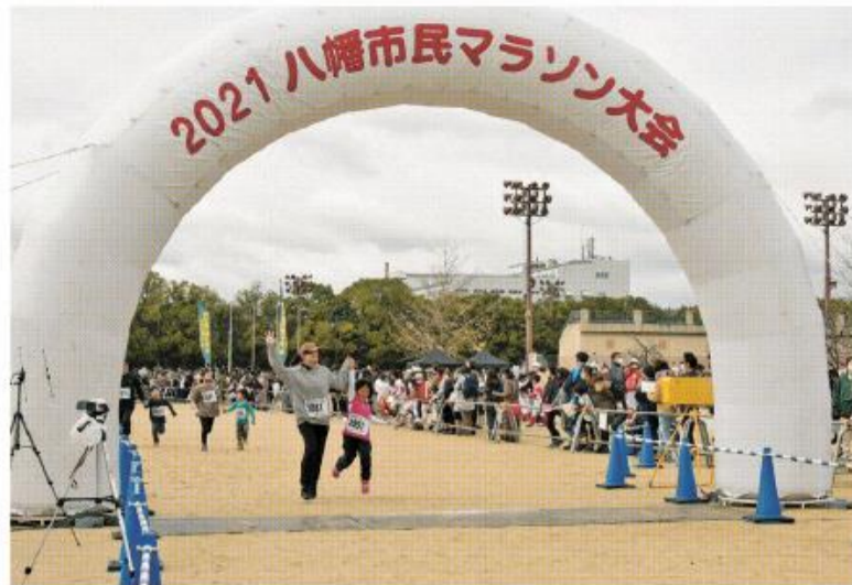
手をつないでゴールする親子