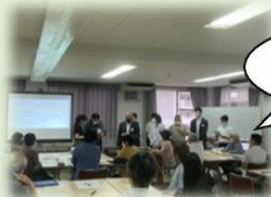
イベント当日の様子

イベントには、にほんご教室「世界はテマン」で日本語を学ぶベトナム人生徒と、多くの地域住民の皆さまが参加し、ゲームなどを通じて交流を深めました。