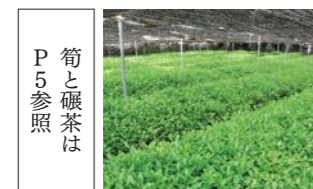
碾茶 Leaves of powdered green tea