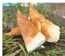
筍 Bamboo shoot