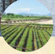
日本最長級 の木造橋