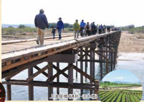
上津屋橋(通称:流れ橋)