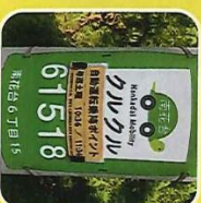
自動運転乗降ポイント