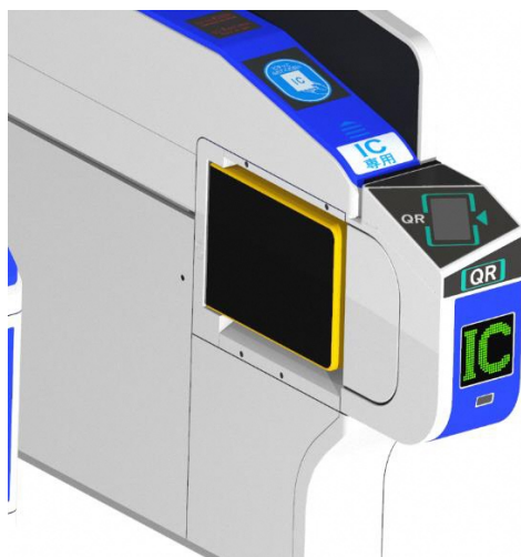
QR コード乗車券、IC カード対応改札機 (イメージ)