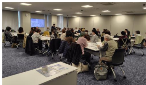
▲昨年度実施した講座の様子