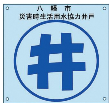
(右上から時計回りに)登録井戸の標識と、標識の設置例