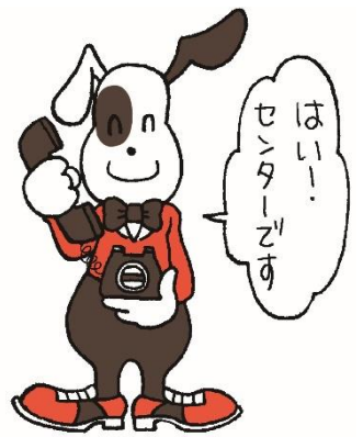
マスコットキャラクター クーリン君