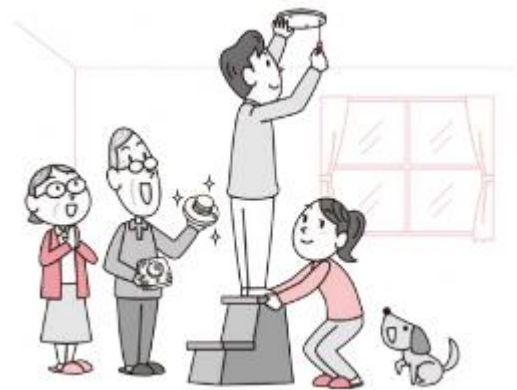
国民生活センター「くらしの危険」No.347 より

住宅用火災警報器は、消防法により設置が義務付けられています。住宅用火災警報器が設置されている場合は、設置されていない場合に比べ、死者数と損害額は半減、焼損床面積は6割減（消防庁）となっています。住宅用火災警報器は常にセンサーが作動しています。故障や電池切れをしていないか、定期的に点検し、10年を目安に本体を交換しましょう。