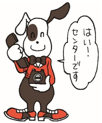
マスコットキャラクター クーリン君