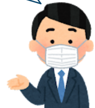
生活情報センター

商品・役務別相談件数(契約当事者18歳・19歳)令和4年度上位7位 (各年度10月末時点)