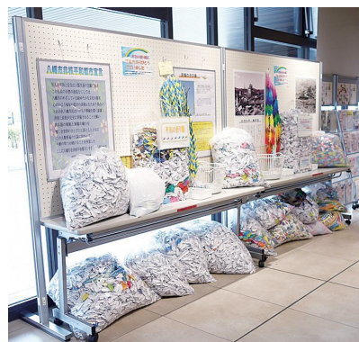
昨年寄せられた折り鶴

折り鶴は、8月2日(金)まで市役所で展示した後、同協議会により、広島平和記念公園の「原爆の子の像」にささげられます。