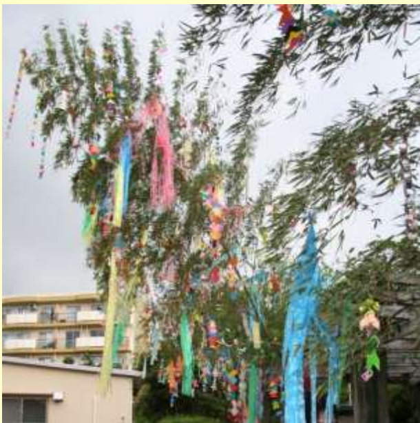
男山第4住宅七夕祭りでの笹飾り

今後は、上記支援に加え、他にも福祉や環境問題を扱う団体への支援を活発化させたいと願っています。