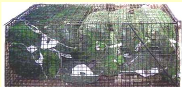
竹炭が入られた「蛇カゴ」

竹炭には、水質浄化、土壌改良、消臭脱臭、湿度調整、遠赤外線、抗菌の効果があるとされ、竹炭の高い吸着能力で河川の汚染物質を取り除き、吸着された汚染物質を竹炭に繁殖する微生物によって分解されることで水質が浄化されることは周知のことですが、生活排水や畑の肥料や農薬等により、どれだけの水質改善が見られるかは未知数と、水質浄化を専門とする大学准教授からコメントを戴き、竹炭による水質浄化実験が当年の10月より開始いたしますので、皆様が「河川を汚さない」意識を持ってご協力下さいますようお願いいたします。