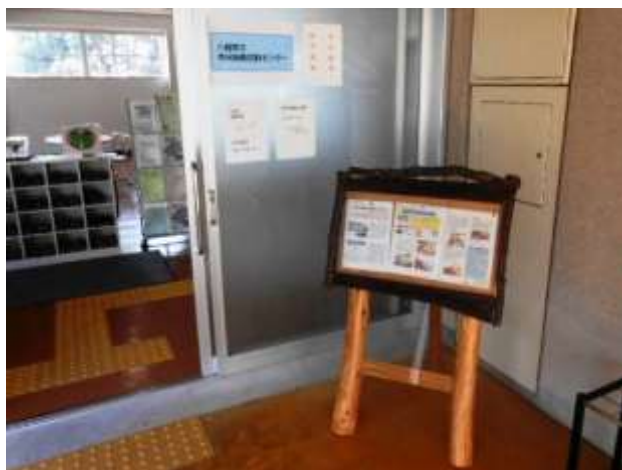
活動センター入口前に設置