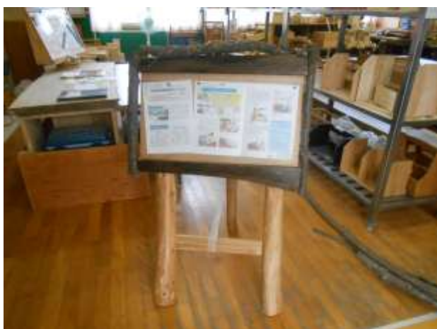
間伐材などを活用して作成された木製掲示板

発行：八幡市市民協働活動センター (運営：特定非営利活動法人八幡まちづくり協会)