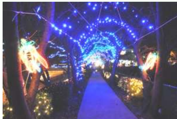
さくら公園内通路のライトアップ