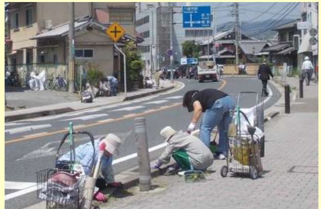
大谷川と市内道路での清掃活動