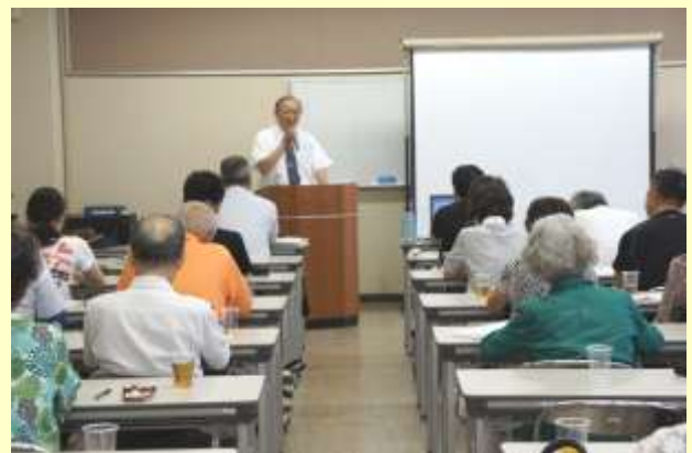
第7回講演会での税理士による講演