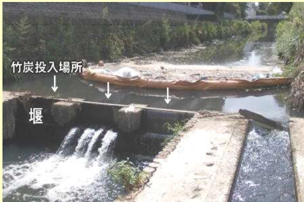
大谷川での竹炭投入場所

その中で「ホタルの飛び交う大谷川」を夢見て、「竹炭による大谷川の浄化実験」に着手すべく、八幡市との協議を重ねた上で大谷川への竹炭投入が決定されました。