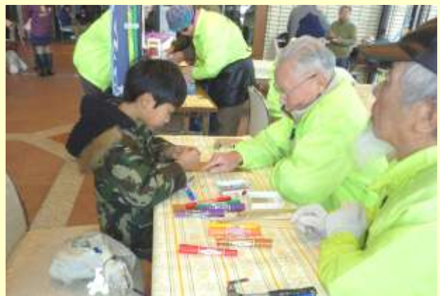
八幡たけくらぶ会員と福祉のつどいで竹細工教室