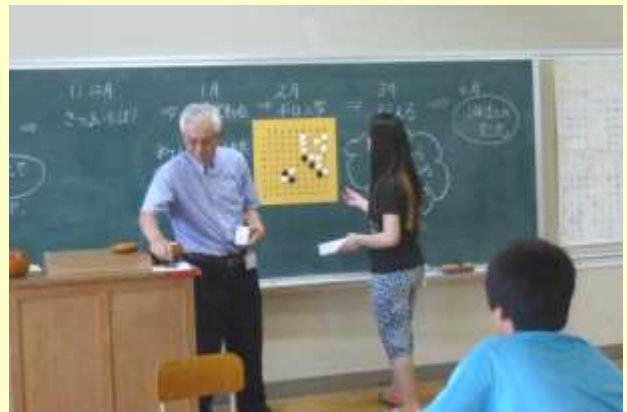
中央小学校での囲碁教室の様子

詳しくは、ホームページをご参照いただき、お問い合わせや多くの方々が積極的に事業へご参加下さることを現会員一同が両手を広げてお待ちしております。