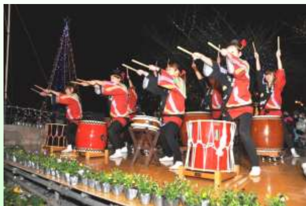
オープニングセレモニーでの和太鼓演奏