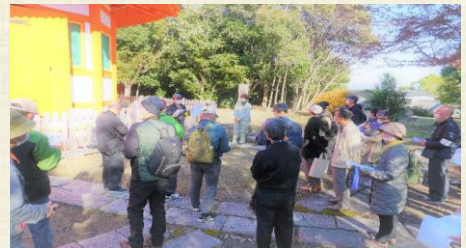
12月例会（歴史探訪ウォーク）：八角堂見学