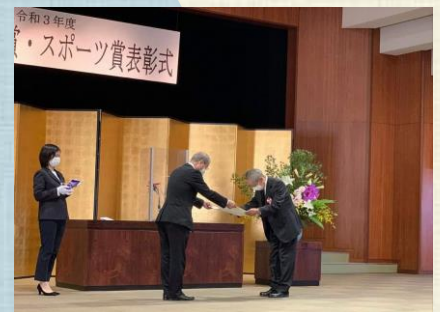
八幡市長より表彰を受ける

ここ2年はコロナ感染防止の観点から、一般ガイドの中止や「観光情報ハウス」も休業など思うように活動出来ない時期もありましたが、これからも42名いる会員一致協力して、八幡市のPRに努めたいと思います。