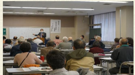
11月例会（講演と交流の集い）：文化センター