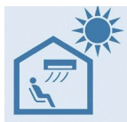
このマークが目印！

熱中症特別警戒アラートが発表された際に暑さをしのぎ、誰でも休憩できる場所を確保するため、市内の15施設を「クーリングシェルター」として指定しています。この施設は10月21日（水）まで熱中症特